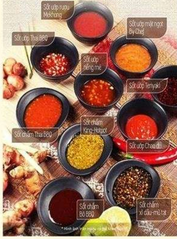
Sốt ướp rượu Mekhong

Trong thế giới ẩm thực phong phú, đa dạng về sốt, nếu các nước Âu Mỹ chuộng các loại sốt trắng và sốt nâu như bơ, sữa, kem béo... thì tại nhiều quốc gia châu Á, các loại nước tương, nước mắm và các loại sốt cay, chua, mặn thống trị bán bán. Đặc biệt là Thái Lan, với nền ẩm thực lâu đời phong phú về đa dạng kết hợp các loại gia vị bí truyền. Thái BBQ trân trọng mang đến quý khách hàng 4 loại sốt chấm và 6 loại sốt ướp đặc biệt để trải nghiệm thú vị hơn nhiều lần.