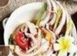
* Mực hấp thơm ngon