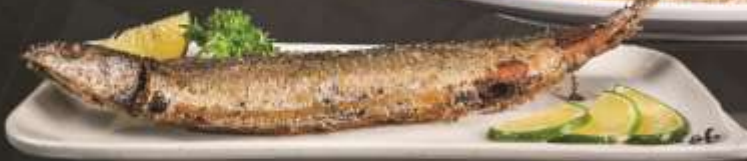
55.000 VNĐ Cá thu đao nướng muối Salt grilled mackerel