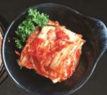
20.000 vnd Kim chi Kim chi