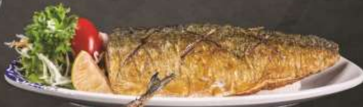
55.000 VNĐ Cá saba nướng muối Salt grilled saba fish