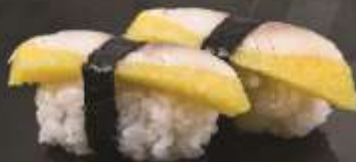
39.000 vnd Sushi nigiri cá trích vàng Gold herring nigiri