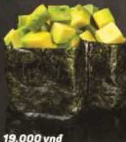
19.000 vnd Sushi gunkan quả bơ Avocado gunkan