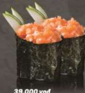
39.000 vnd Sushi gunkan salad cá hồi Salmon salad gunkan