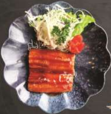
185.000 VNĐ Lươn Nhật nướng sốt teriyaki Tariyaki grilled eel