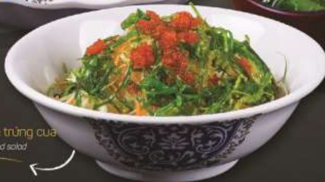
45.000 vnd Salad Rong biển trứng cua Squid eggs and seaweed salad