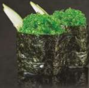
45.000 vnd Sushi gunkan trứng cua xanh Green crab egg gunkan