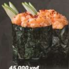
45.000 vnd Sushi gunkan salad cá hồi sốt cay Spicy sauce salmon gunkan