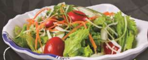
29.000 vnd Salad Rau xanh Green Salad