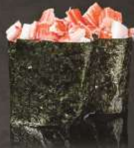
35.000 vnd Sushi gunkan thịt cua đỏ Red crab gunkan