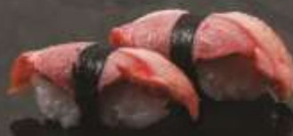
29.000 vnd Sushi lươn ngỗng xông khói Smoked goose breast nigiri