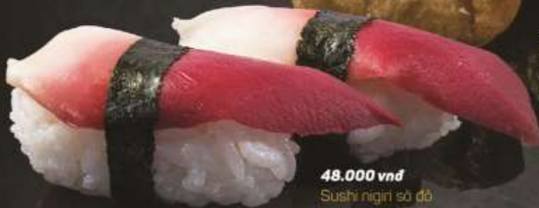
48.000 vnd Sushi nigiri sò đỏ Red oyster nigiri