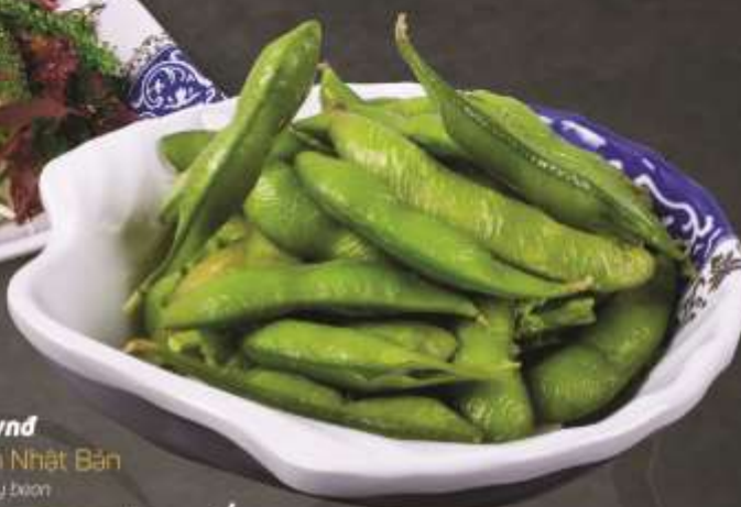
20.000 vnd Đậu nành Nhật Bản Japanese soy bean