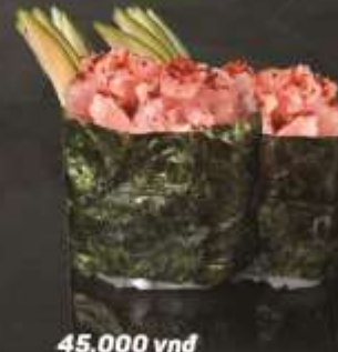
45.000 vnd Sushi gunkan salad cá ngừ sốt cay Spicy sauce tuna gunkan