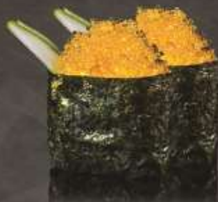
45.000 vnd Sushi gunkan trứng cua vàng Gold crab egg gunkan