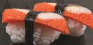
39.000 vnd Sushi nigiri cá trích đỏ Red herring nigiri