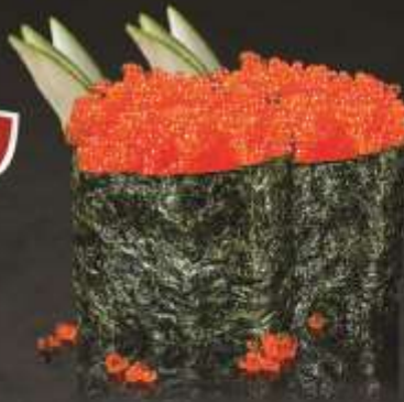
45.000 vnd Sushi gunkan trứng cua đỏ Red crab egg gunkan