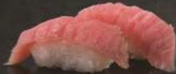
35.000 vnd Sushi nigiri cá ngừ Tuna nigiri