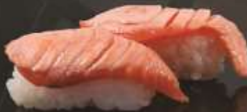
35.000 vnd Sushi nigiri cá hồi aburi Aburi Salmon nigiri