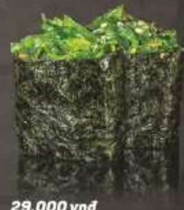
29.000 vnd Sushi gunkan rong biển tươi Fresh sea weed gunkan