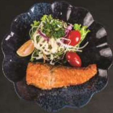
79.000 VNĐ Thăn cá hồi nướng muối Salt grilled salmon tenderloin