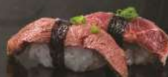
29.000 vnd Sushi nigiri thịt bò tataki Tataki beef nigiri