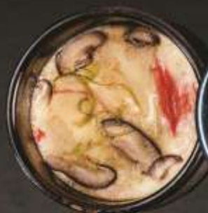
20.000 vnd Trứng hấp hải sản Chawanmushi