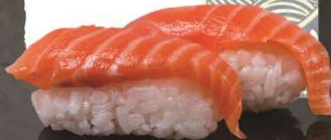
35.000 vnd Sushi nigiri cá hồi Salmon nigiri