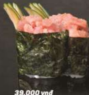
39.000 vnd Sushi gunkan salad cá ngừ Tuna salad gunkan