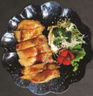
55.000 VNĐ Gà sốt teriyaki Tariyaki Chicken