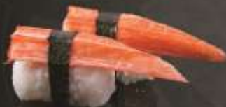
29.000 vnd Sushi nigiri thịt cua Crab nigiri