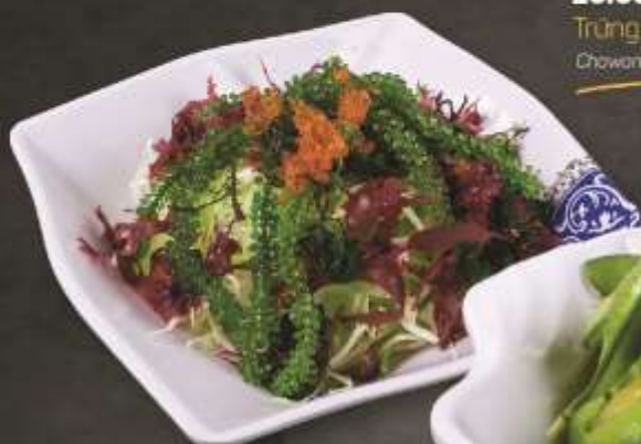
48.000 vnd Salad tosaka Tosaka salad