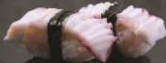
48.000 vnd Sushi nigiri bạch tuộc Octopus nigiri