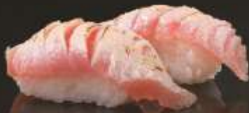
35.000 vnd Sushi nigiri cá ngừ aburi Aburi tuna nigiri