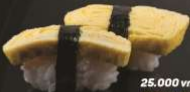
25.000 vnd Sushi nigiri trứng ngọt Sweet egg nigiri