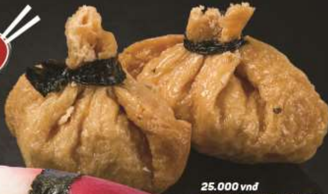
25.000 vnd Sushi nigiri vỏ đậu nướng Grilled pea pod nigiri