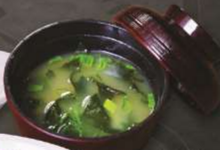
15.000 vnd Súp miso Miso soup