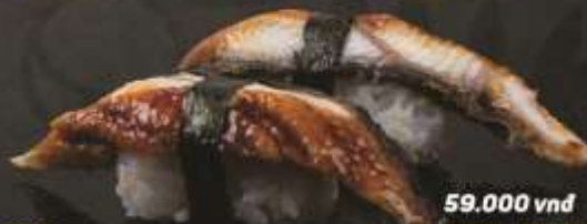
59.000 vnd Sushi nigiri lươn nhật Japanese eel nigiri