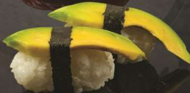
19.000 vnd Sushi nigiri quả bơ Avocado nigiri