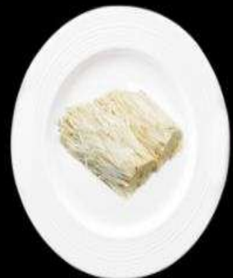
Nấm kim châm