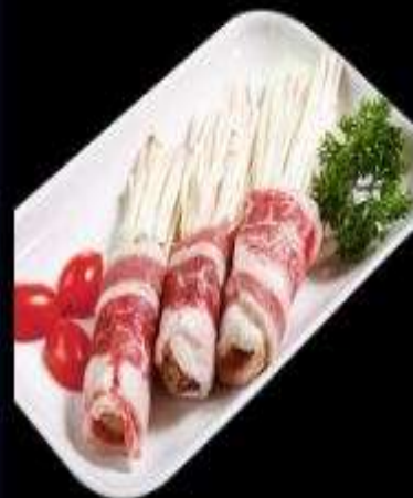
Ba rọi kim châm