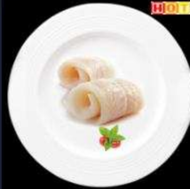
Phi lê cá