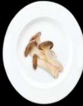
Nấm đùi gà