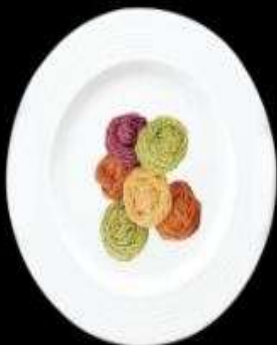
Mi rau củ