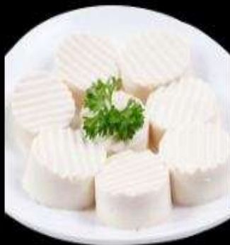
Đậu hủ non