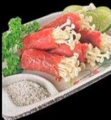
Bò cuốn kim châm