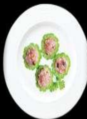
Khô qua nhồi