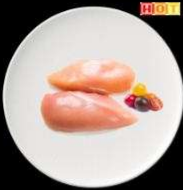
Phi lê gà