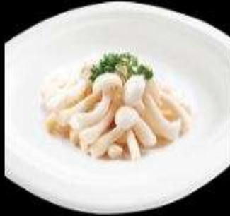
Nấm linh chi