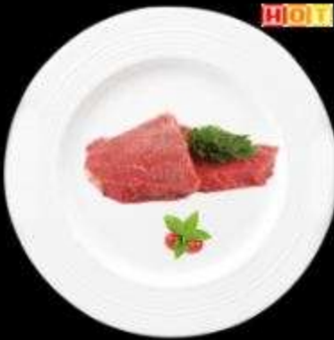
Phi lê thịt