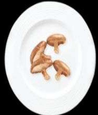
Nấm đông cô