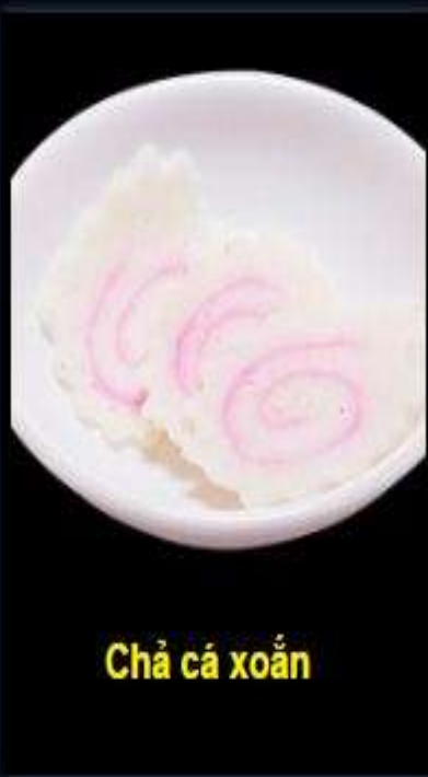
Chả cá xoăn