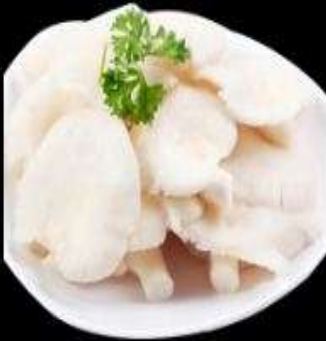
Nấm bào ngư