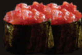
■ Cá Ngừ Saku Sốt Mayonnaise/ Tuna Saku Mayonnaise Gunkan