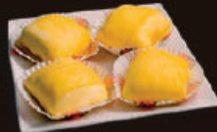
■ Bánh Sầu Riêng Durian Cake

Thời gian dùng bữa: 150 phút/ Duration: 150'