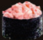
■ Cá trích Ép Trứng Sốt Mayonnaise/ Nishin With Mayonnaise Gunkan