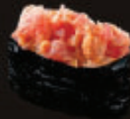
■ Cá Ngừ Saku Sốt Cay/ Spicy Tuna Saku Gunkan