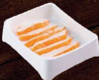
Lườn cá hồi Salmon belly