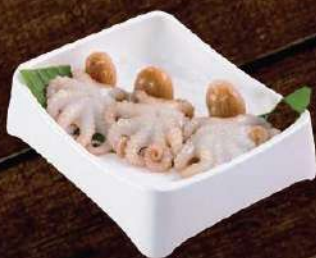
Bạch tuộc baby 🔥 Baby octopus