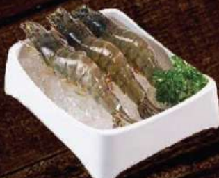
Tôm thẻ 🔥 Prawn