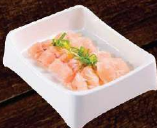
Cá phi lê Fish fillet