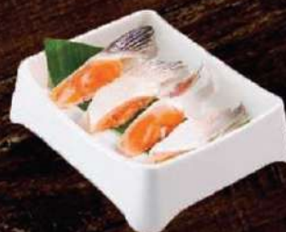
Vây cá hồi Salmon fin