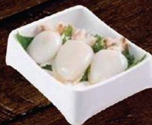
Mực nang 🔥 Cuttlefish