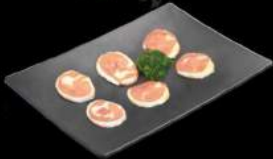
Má đùi gà Chicken drumsticks