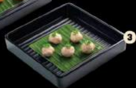
3 Bò viên Beef ball