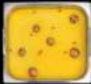
Lẩu gà hấm Chicken