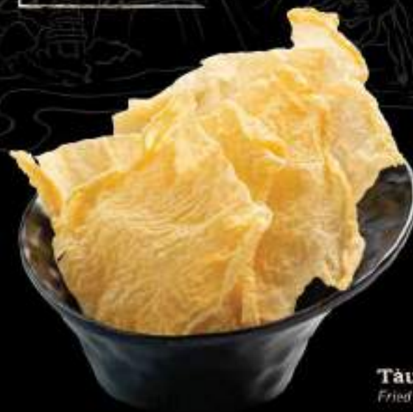
Tàu hủ ky chiên Fried tofu skin