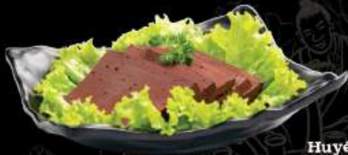
Huyết vịt Duck blood