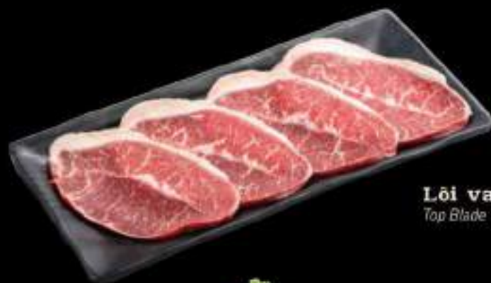
Lõi vai bò Mỹ Top Blade