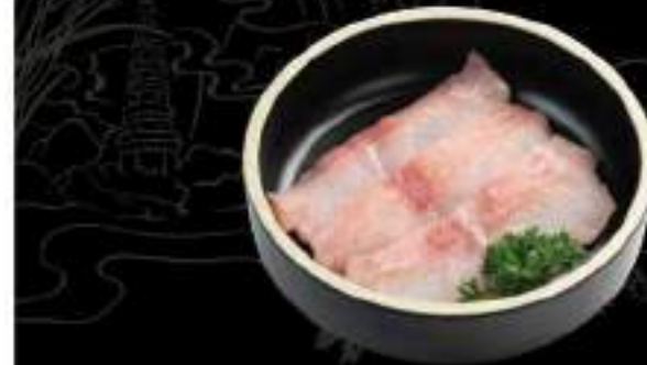
Basa Basa fillet