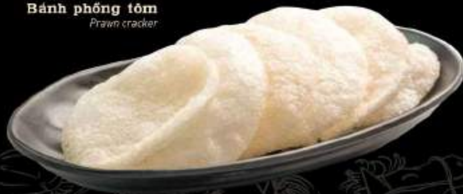
Bánh phồng tôm Prawn cracker