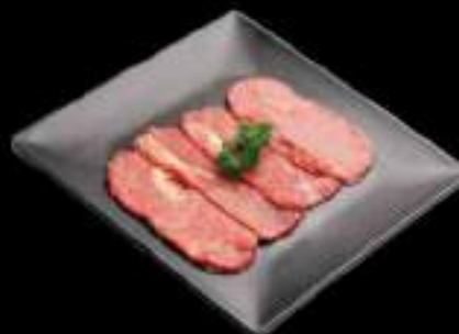
Cổ bò Beef neck