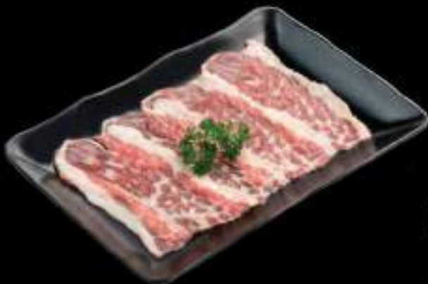
Gầu bò Úc Brisket Beef