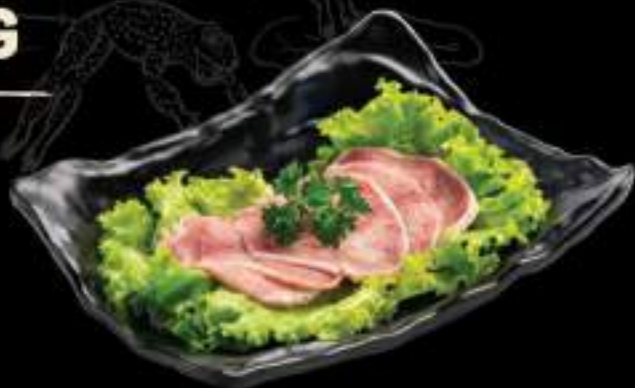
Lưỡi bò Beef tongue