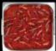
Lẩu Mala King Mala