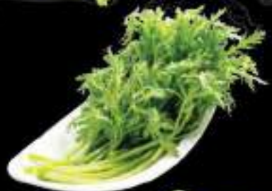
Rau tần ô Tung ho