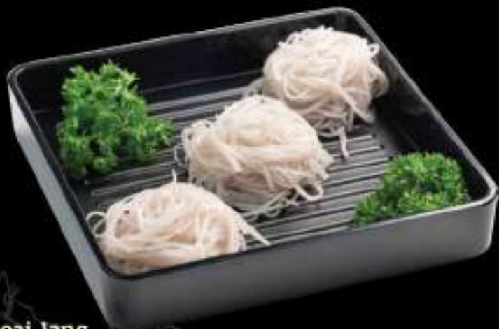
Miến khoai lang Glass noodle