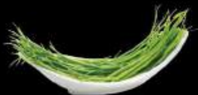
Rau muống Water morning glory