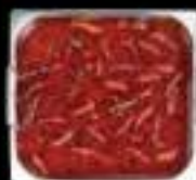
Lẩu Mala King Mala