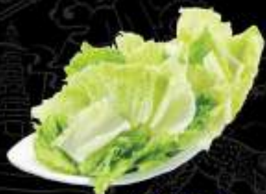
Cải thảo Cabbage