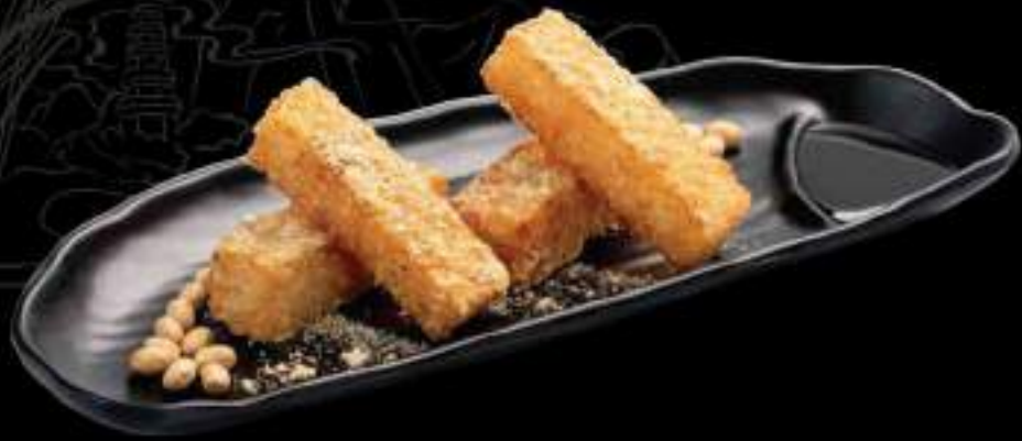
Bánh nếp chiên giòn đường đen Glutinous cake with brown sugar