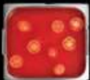
Lẩu cà chua Tomato