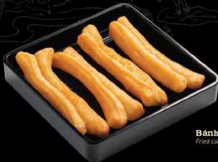
Bánh quẩy Fried cake