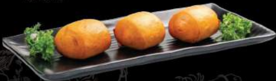
Bánh bao chiên Mạn thau fried