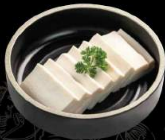
Tàu hủ Tofu