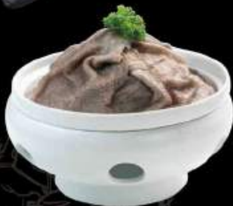
Lá sách bò đen Beef tripe