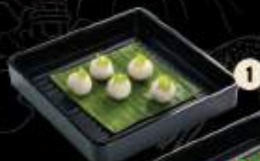
1 Cá viên Fish ball