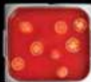
Lẩu cà chua Tomato