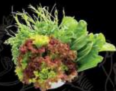
Rau thập cẩm Mix vegetables