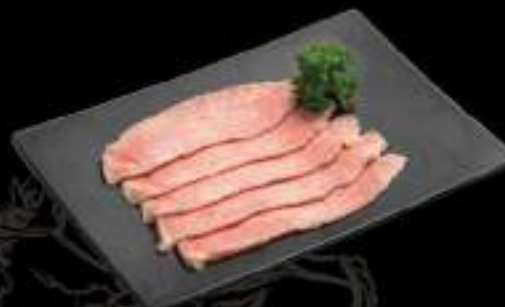
Vú heo Pork breasts