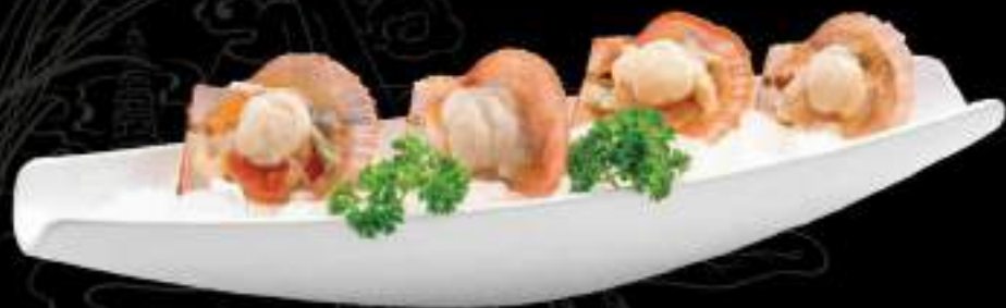
Sò điệp nửa mảnh 1/2 self scallop