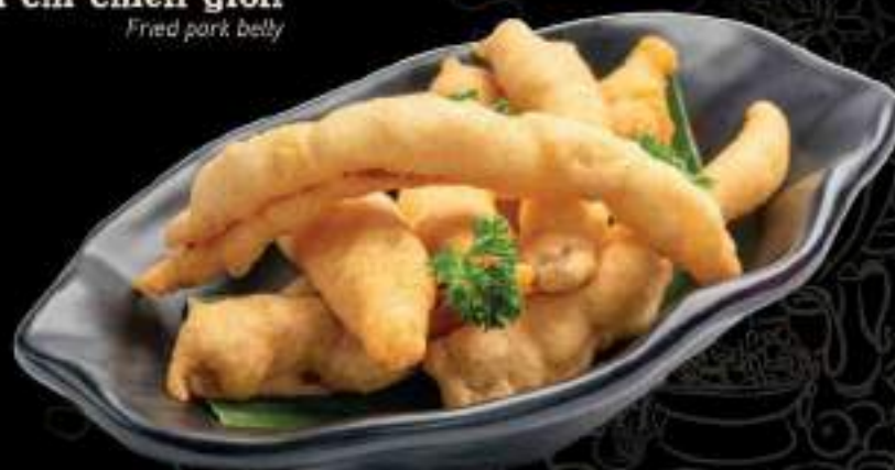
Ba chỉ chiên giòn Fried pork belly