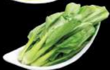
Cải thìa Bok choy