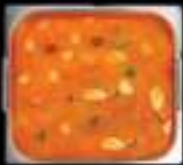
Lẩu Tomyum Tomyum

BAO GỒM TẤT CẢ CÁC MÓN TRONG BUFFET 308K