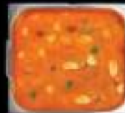
Lẩu Tomyum Tomyum

BAO GỒM TẤT CẢ CÁC MÓN TRONG BUFFET 258K