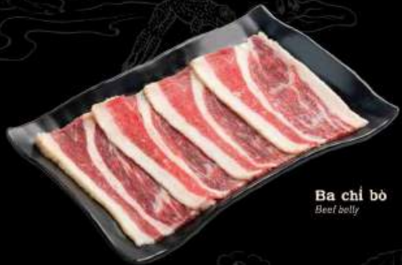
Ba chỉ bò Beef belly