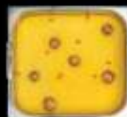
Lẩu gà hăm Chicken