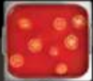
Lẩu cà chua Tomato