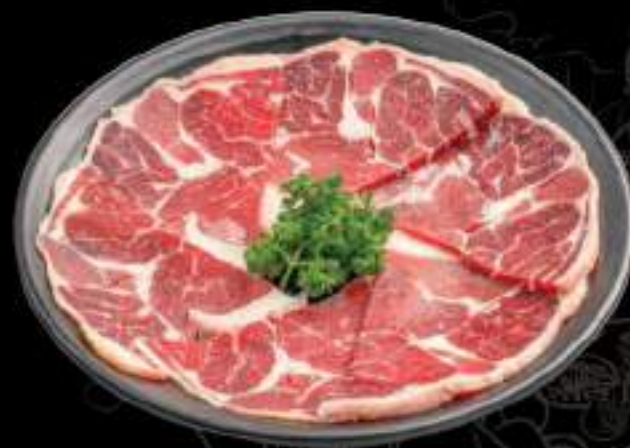
Bắp bò Úc Beef muscle