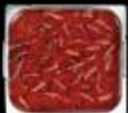
Lẩu Mala King Mala