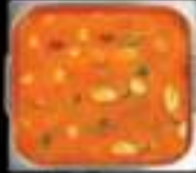
Lẩu Tomyum Tomyum