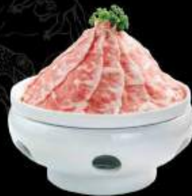
Gù hoa bò Mỹ Beef brisket