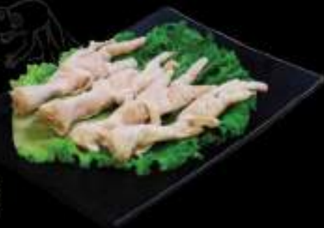
Chân gà rút xương Boneless Chicken Feet