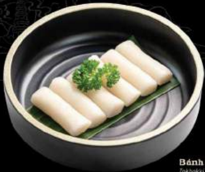
Bánh gạo Hàn Quốc Takbokki