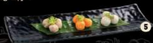
5 Viên tổng hợp 1 Mix balls 1