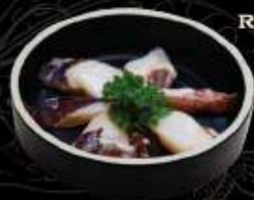
Râu mực Squid beard