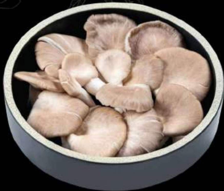
Nấm bào ngư Abalone mushroom