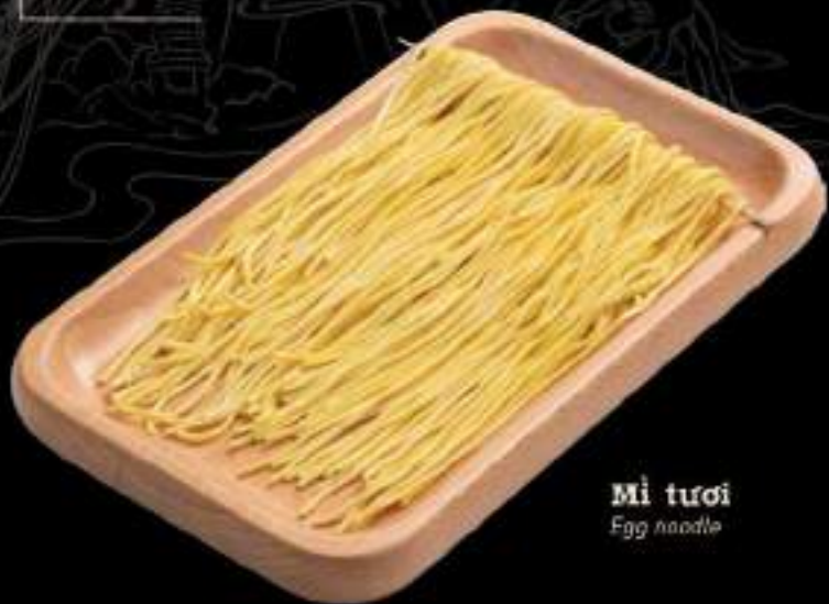
Mì tươi Egg noodle