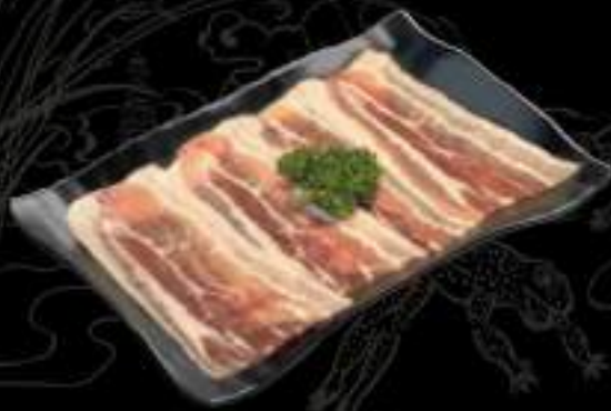
Ba chỉ heo Pork belly