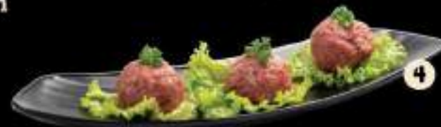
4 Paste bò Beef paste