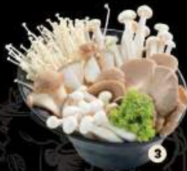
1 Nấm bạch tuyết Snow white mushroom