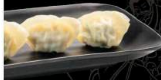
Sủi cảo Gyoza