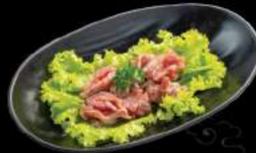
Mề gà Chicken gizzard