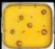
Lẩu gà hầm Chicken