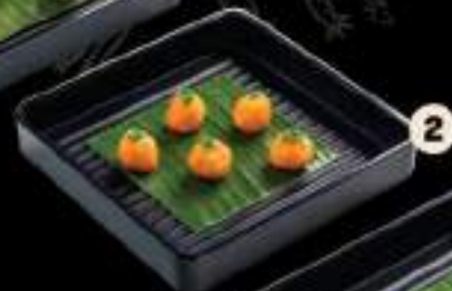
2 Tôm viên Prawn ball