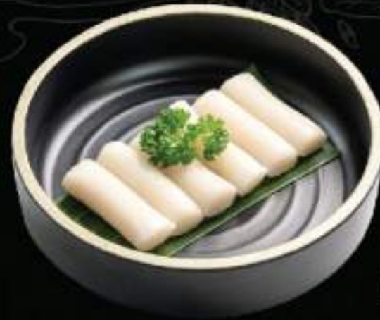
Bánh gạo Hàn Quốc Tokbokki