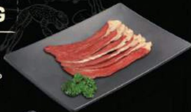
Tim bò Beef heart