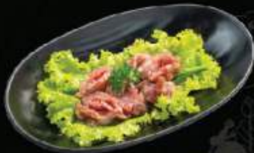
Mế gà Chicken gizzard