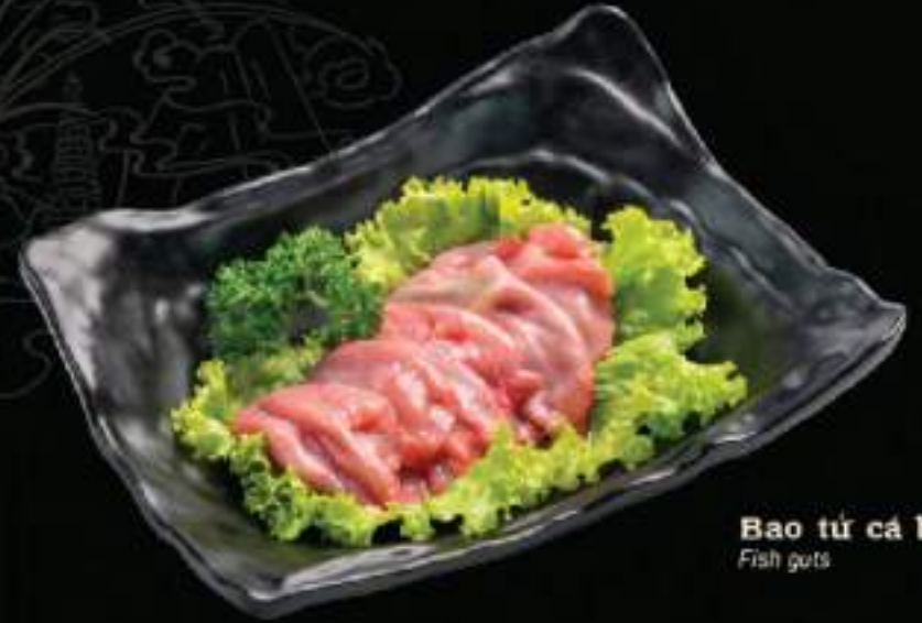
Bao tử cá basa Fish guts