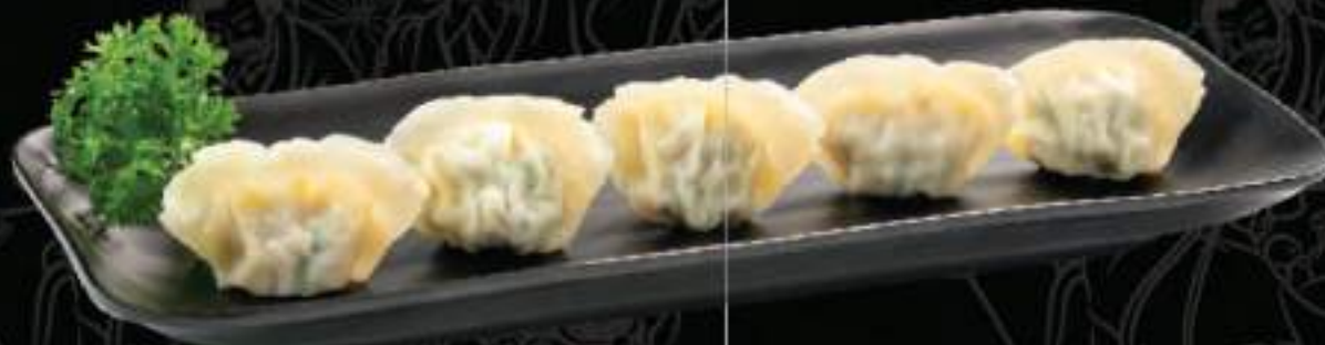
Sủi cảo Gyoza