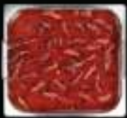
Lẩu Mala King Mala