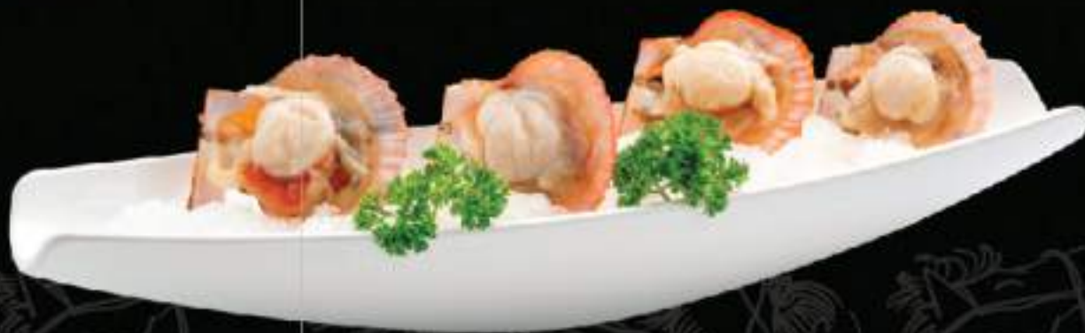
Sò điệp nửa mảnh 1 self scallop