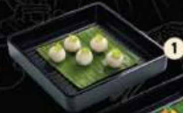
1 Cá viên Fish ball