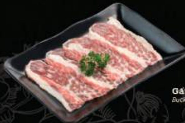
Gầu bò Úc Bucket beef