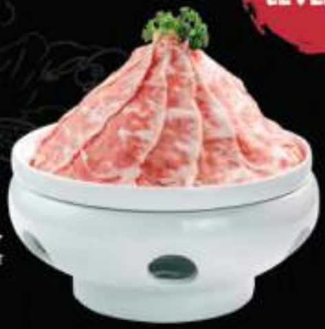
Gù hoa bò Mỹ Beef brisket