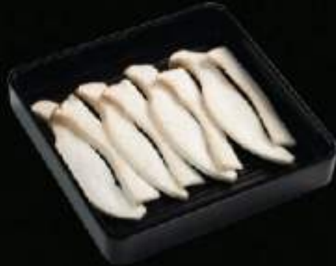
Nấm đùi gà Drumstick mushroom