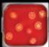
Lẩu cà chua Tomato