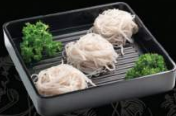
Miến khoai lang Glass noodle