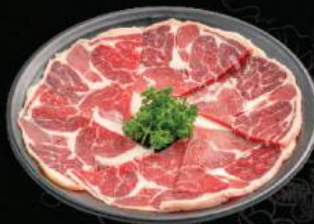
Bắp bò Úc Beef muscle