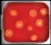
Lẩu cà chua Tomato