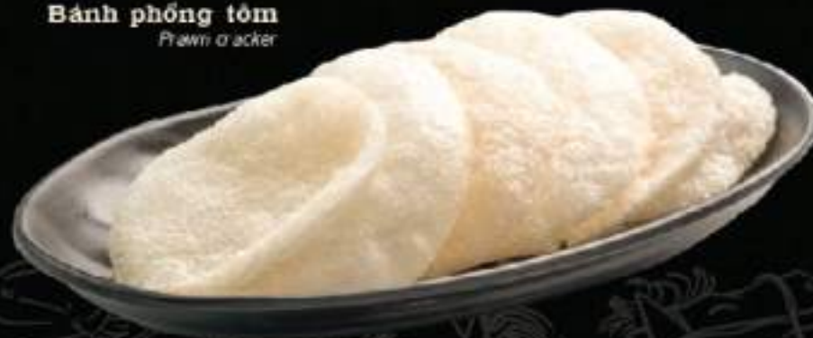
Bánh phồng tôm Prawn cracker