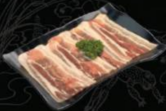
Ba chỉ heo Pork belly