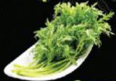
Rau tăn ó Turigo