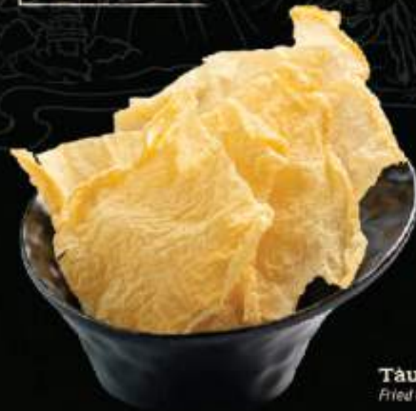
Tàu hũ ky chiên Fried tofu skin