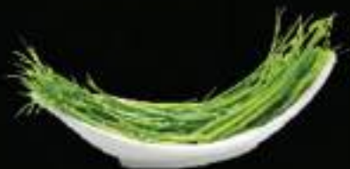
Rau mướt Water morning glory