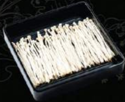
Nấm kim châm Enokitake