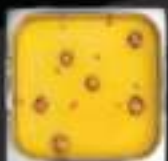
Lẩu gà hăm Chicken