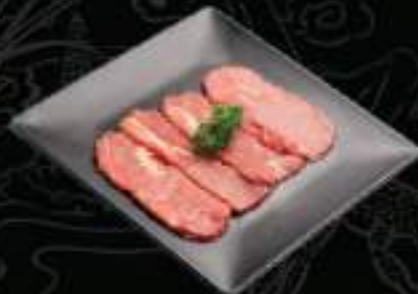
Cổ bò Beef neck