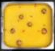
Lẩu gà hầm Chicken

BAO GỒM TẤT CẢ CÁC MÓN TRONG BUFFET 298K