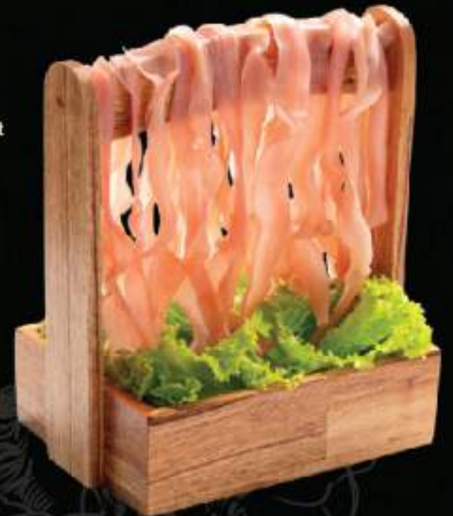
Ruột vịt Duck gut