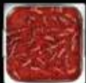
Lẩu Mala King Mala