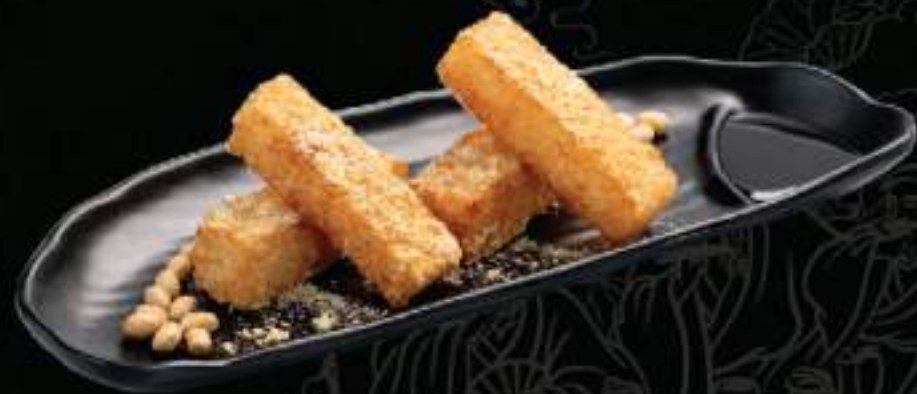
Bánh nếp chiên giòn đường đen Glutinous cake with brown sugar