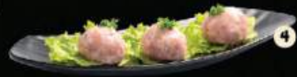
6 Viên tổng hợp 1 Mix balls 1