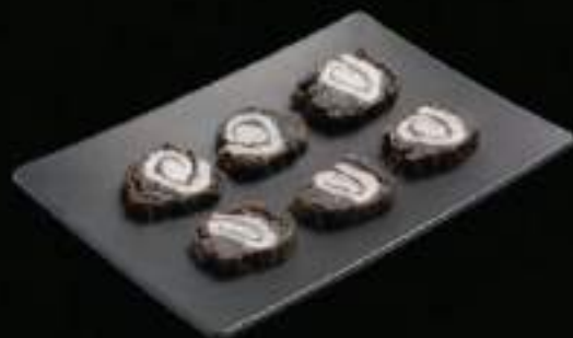
Lá sách cuộn Beef tript roll