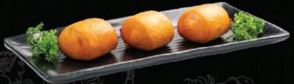
Bánh bao chiên Manthou fried