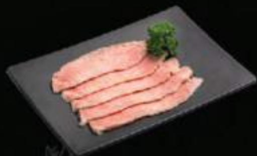
Vũ heo Pork breasts