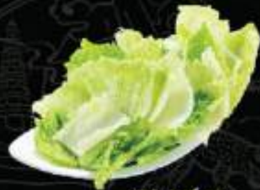
Cải thảo Cabbage