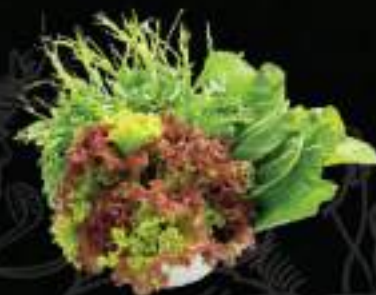
Rau thập cẩm Mix vegetables