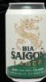
Sài Gòn Xanh 25k