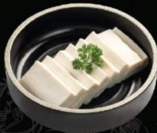
Tàu hũ Tofu