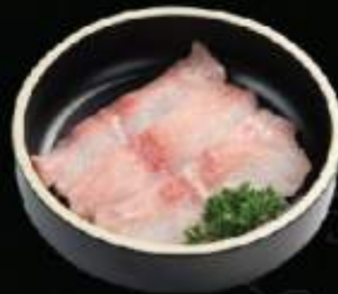
Basa Basa fillet