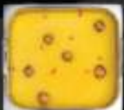
Lẩu gà hầm Chicken

BAO GỒM TẤT CẢ CÁC MÓN TRONG BUFFET 258K