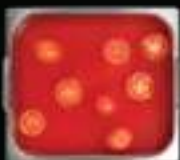
Lẩu cà chua Tomato