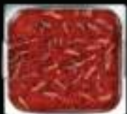
Lẩu Mala King Mala