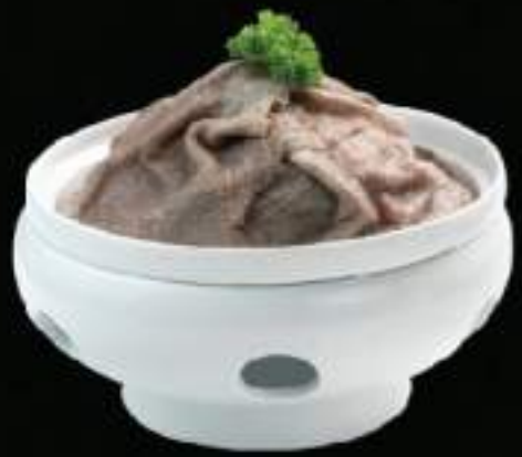
Lá sách bò đen Beef tripe