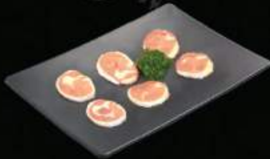
Má đùi gà Chicken drumsticks