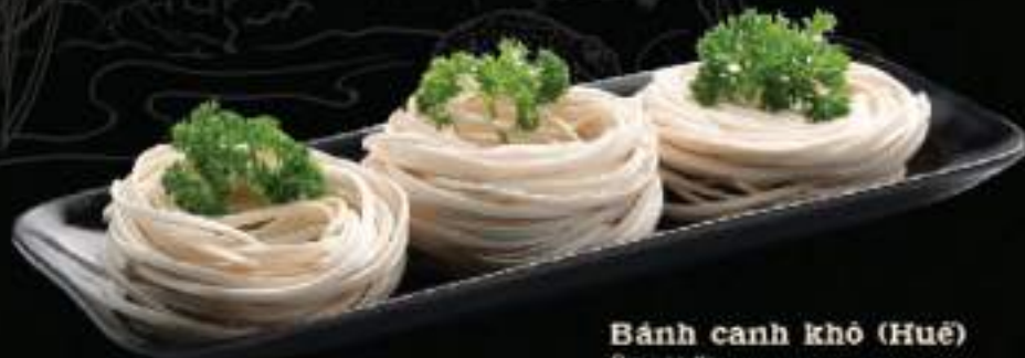
Bánh canh khô (Huế) Dry noodle