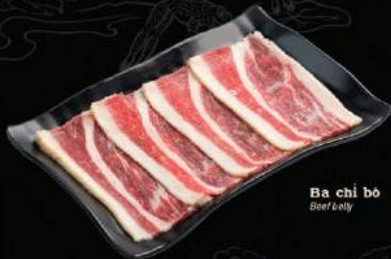
Ba chỉ bò Beef belly