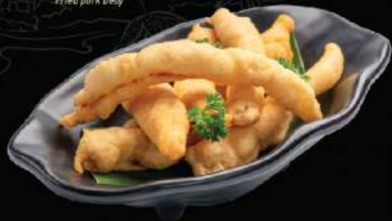
Ba chỉ chiên giòn Fried pork belly