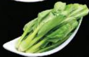
Cải thìa Bok choy