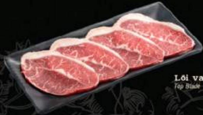
Lõi vai bò Mỹ Top Blade