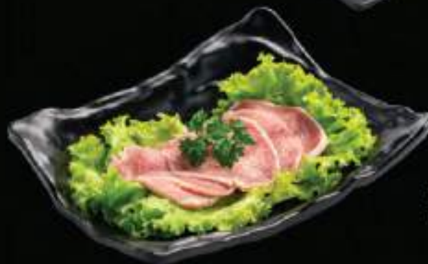
Lưỡi bò Beef tongue