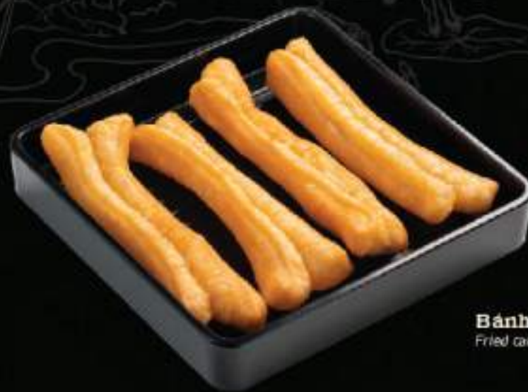
Bánh quẩy Fried cake