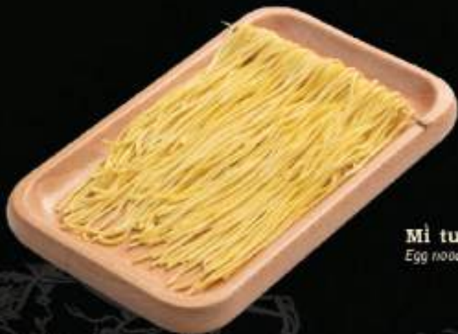
Mì tươi Egg noodle