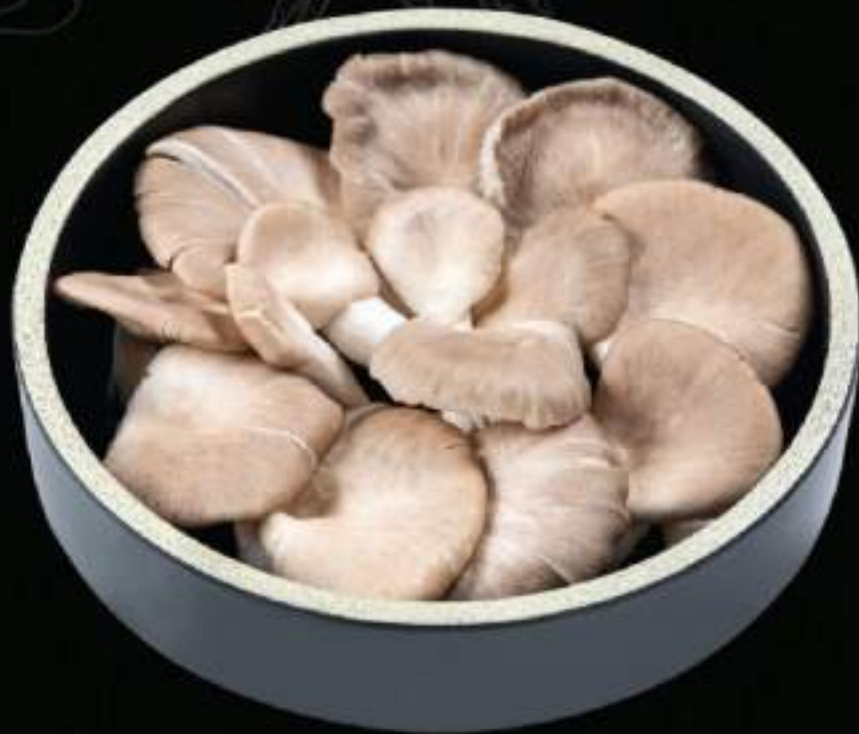
Nấm bào ngư Abalón mushroom