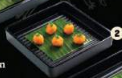
2 Tôm viên Prawn ball