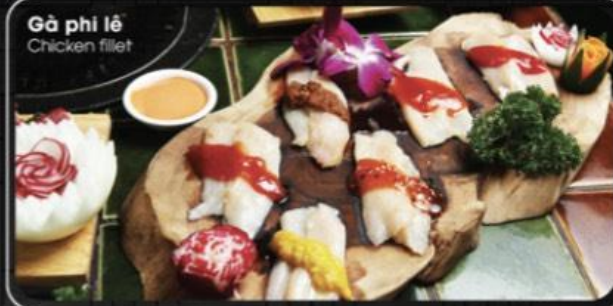
Gà phi lê Chicken fillet

• Trẻ em (1m - 1.3m) được giảm 50% khi đi kèm với 1 người lớn.