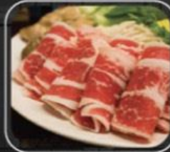
Gầu bò Úc Aus beef brisket