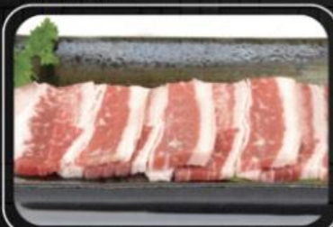
Ba chỉ bò Úc Aus short plate