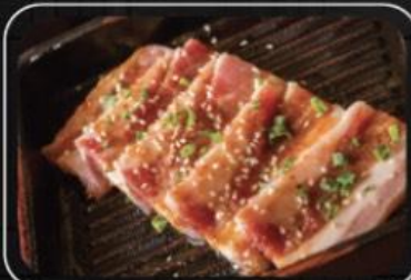
Ba chỉ heo xốt ngũ vị Pork side with 5 spices