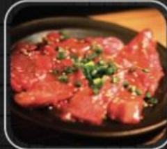
Tim bò Úc Aus beef heart