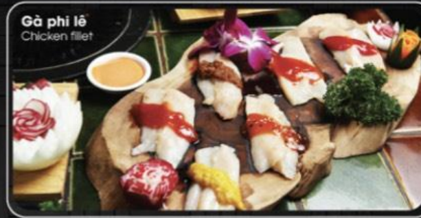
Gà phi lê Chicken fillet

• Trẻ em (1m - 1.3m) được giảm 50% khi đi kèm với 1 người lớn.