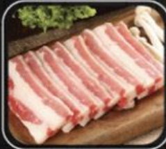
Ba chỉ bò Úc Aus short plate

Để được phục vụ thêm 2 món lẩu đặc biệt LẨU HẢI SẢN VÀ LẨU THÁI