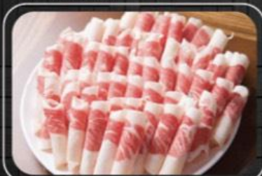
Gầu bò Úc Aus beef brisket