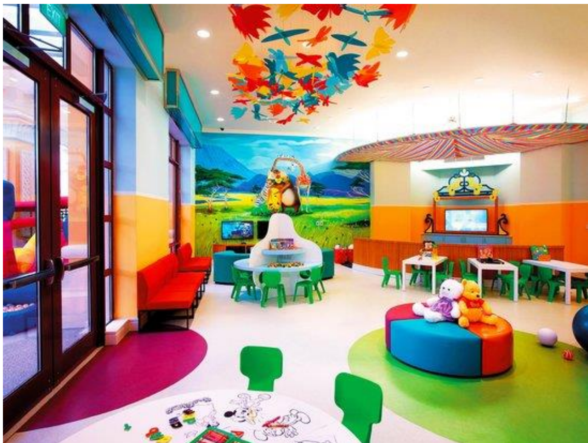
( Góc thiếu nhi tại Grand Hồ Tràm )

13h30: Khởi hành về Hồ Tràm , đoàn làm thủ tục nhận phòng Resort The Grand Hồ Tràm Strip đẳng cấp 5 sao , sang trọng. Nghỉ ngơi tại Grand Hồ Tràm