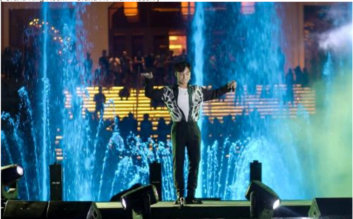
(Đài nhạc nước tại Grand Hồ Tràm Strip hàng đêm từ 18h00 – 21h00 )