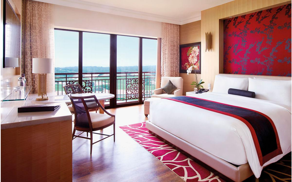
( Grand King Room – Grand Hồ Tràm Resort )

20h00: Xe đưa đoàn về Resort The Grand Hồ Tràm . Quý khách tự do khám phá Hồ Tràm về đêm.