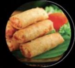
FRIED SPRING ROLL