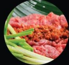
BEEF WITH LEMONGRASS BÒ XỐT SẢ ỚT