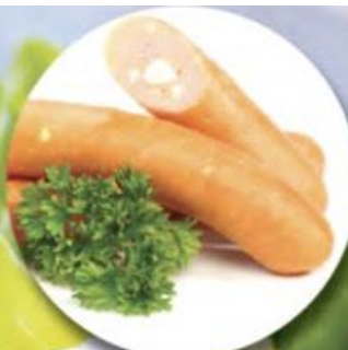
SAUSAGE & CHEESE XÚC XÍCH PHÔ MAI