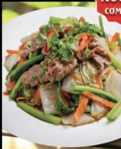
FRIED NOODLE WITH BEEF MÌ XÀO BÒ