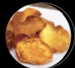
FRIED SWEET POTATO