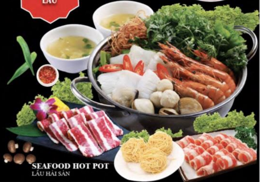
SEAFOOD HOT POT LẨU HẢI SẢN