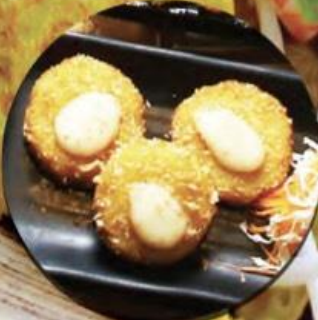
FRIED CHICKEN & POTATO BÁNH GÀ KHOAI TÂY