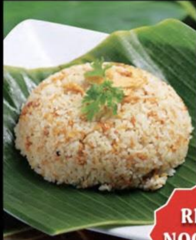
FRIED RICE WITH GARLIC COM CHIÊN TỎI