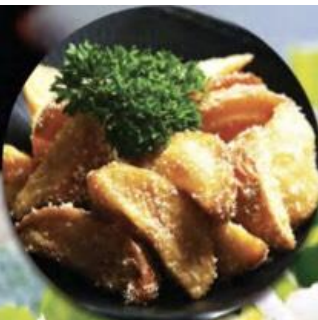
FRIED POTATO W. SESAME KHOAI TÂY BABY CHIÊN XỐT MÈ