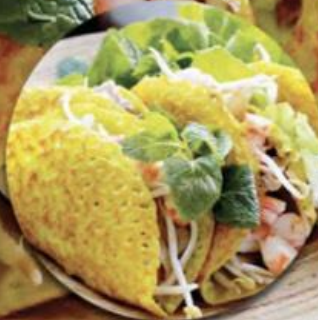
TRADITIONAL PANCAKE BÁNH XÈO

UPGRADE FOR MORE 5 KINDS OF BEEF VỚI 5 LOẠI BÒ ÚC ĐẶC BIỆT MORE + 109.000