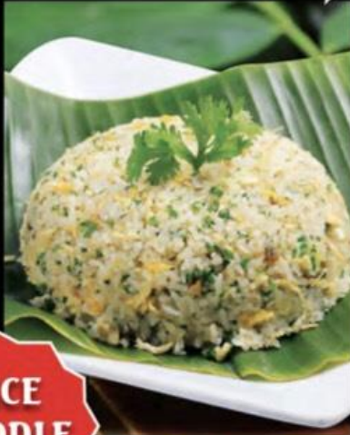
RICE NOODLE CƠM & MÌ