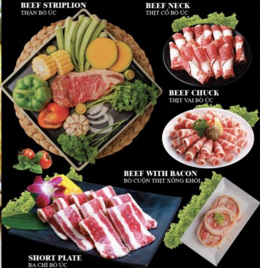
BEEF STRIPLION THÂN BÒ ÚC

UPGRADE FOR MORE 5 KINDS OF BEEF VỚI 5 LOẠI BÒ ÚC ĐẶC BIỆT MORE + 109.000