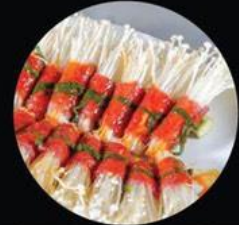
BEEF W. ENOKITAKE BÒ CUỘN NẤM KIM CHÂM