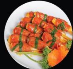
BEEF W. SUGAR CAN BÒ CUỘN MÍA