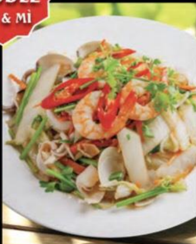
FRIED NOODLE WITH SEAFOOD MÌ XÀO HẢI SẢN