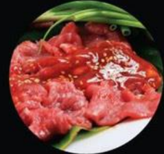
BEEF WITH 5 SPICES BÒ XỐT NGŨ VỊ