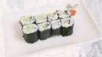
MAKI DƯA LEO | M05 CUCUMBER MAKI | 15,000