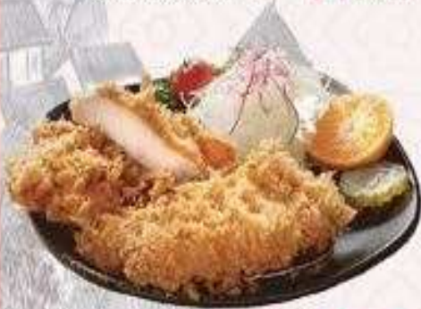
HEO CHIÊN XÙ | K.06 PORK CUTLET | 55.000