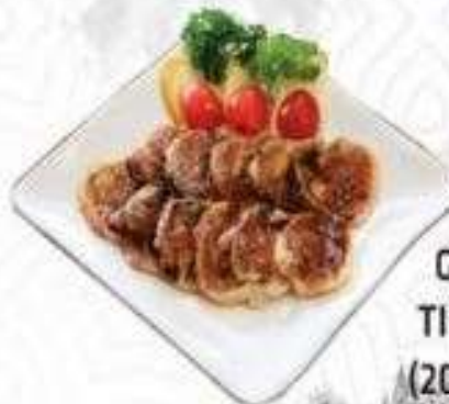
GÀ SỐT TIÊU ĐEN (200 gram)