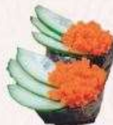
TRỨNG TÔM EBIKO | G.03 30.000