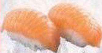
NIGIRI CÁ HỒI SALMON NIGIRI | N.06 28.000