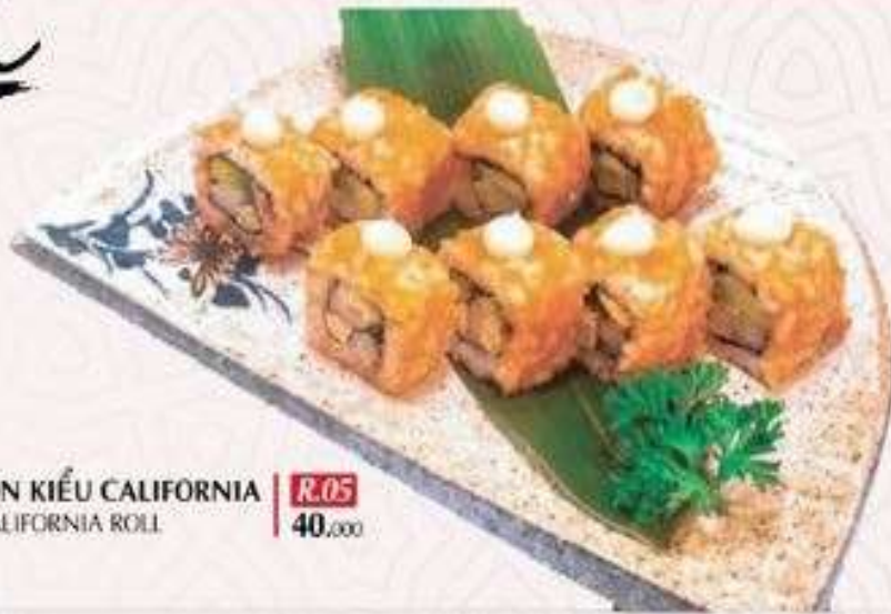
CƠM CUỘN KIỂU CALIFORNIA CALIFORNIA ROLL R.05 40.000