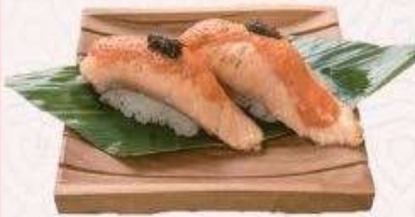
CÁ HỒI SỐT YUKI SALMON WITH YUKI SAUCE | N.01 40.000