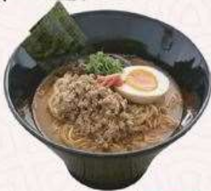
RAMEN THỊT BĂM | RA.01 MINCED PORK RAMEN | 65.000