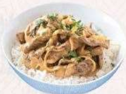
CƠM BÒ MỸ | C.03 US BEEF RICE | 60,000