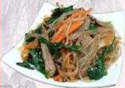
MIẾN XÀO THỊT HEO FRIED PORK VERMICELLI