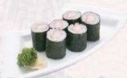
MAKI THANH CUA | M03 CRAB STICK MAKI | 28,000