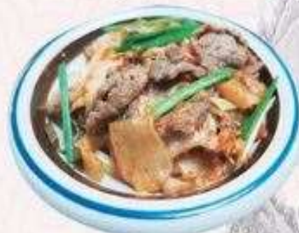
CƠM THỊT HEO XÀO KIMCHI | C.08 STIR-FRIED PORK WITH KIMCHI RICE | 60,000