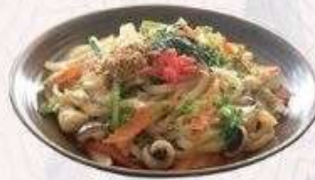
UDON HẢI SẢN XÀO | U.05 STIR-FRIED SEAFOOD UDON | 65,000