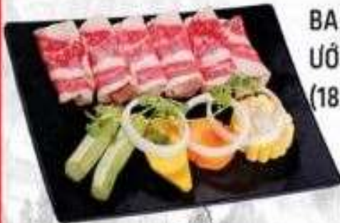
BA CHỈ BÒ MỸ ỚP SA TÊ (180 gram)