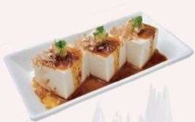
ĐẬU HŨ SỐT TERIYAKI | A.02 TOFU WITH TERIYAKI SAUCE | 25.000