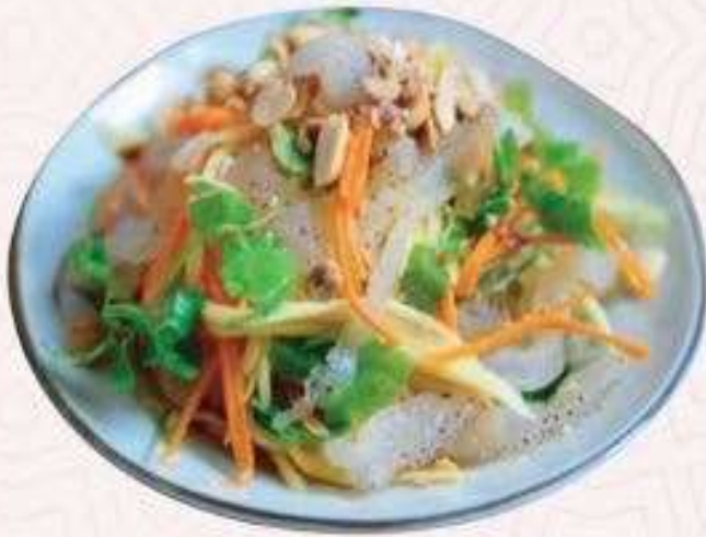
SALAD SÚA TRỘN | SA.05 SCYPHOZOA SALAD | 55,000