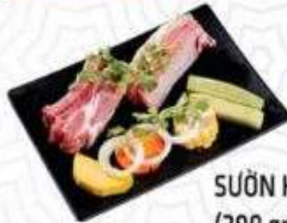
SƯỜN HEO (200 gram)