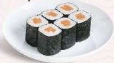
MAKI CÁ HỒI | M01 SALMON MAKI | 38,000