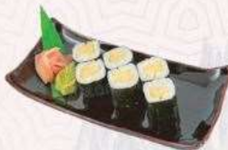
MAKI TRỨNG | M04 EGG MAKI | 20,000