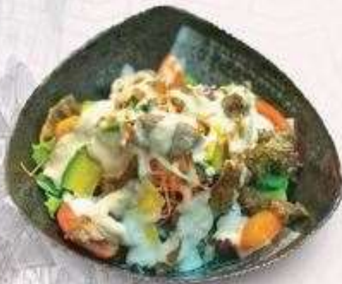
SALAD DA CÁ HỒI CHIÊN FRIED SALMON SKIN SALAD