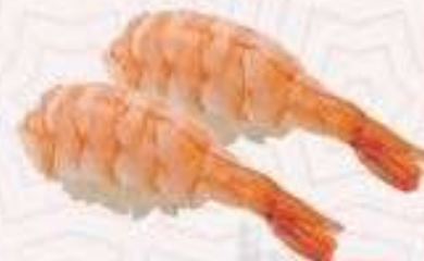
NIGIRI TÔM EBI NIGIRI | N.05 25.000