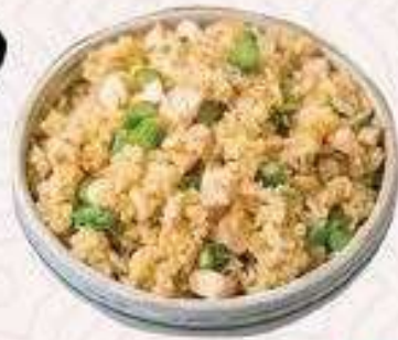
CƠM CÁ HỒ CHIÊN | C.02 FRIED SALMON RICE | 60,000