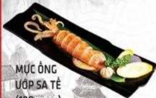
MỰC ỚNG ƯỚP SA TÊ (180 gram)