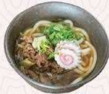
UDON BÒ MỸ | U.03 US BEEF UDON | 68,000