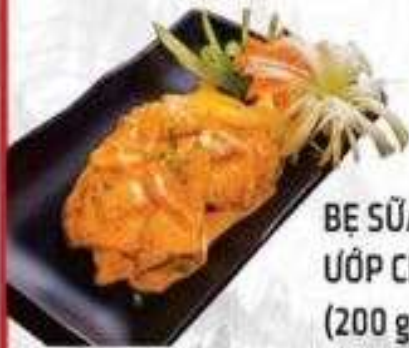
BÈ SỮA HEO ỚP CHAO (200 gram)