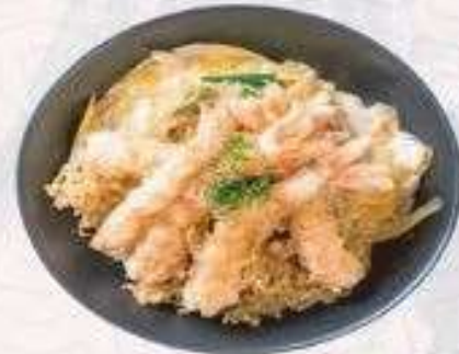
CƠM TÔM CHIÊN XÙ | C.06 FRIED SHRIMP RICE | 80,000