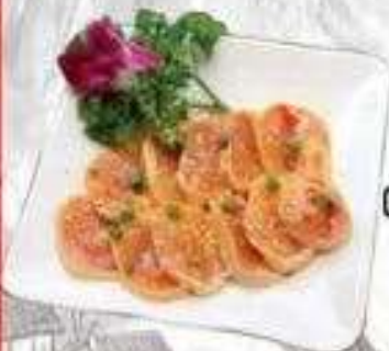
GÀ ỚP SATÊ (200 gram)