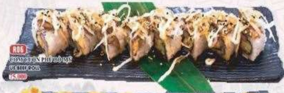
R.06 CƠM CUỘN PHU HỒ MỸ US BEEF ROLL 45.000