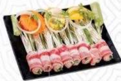
BA CHỈ BÒ MỸ CUỘN NĂM (180 gram)