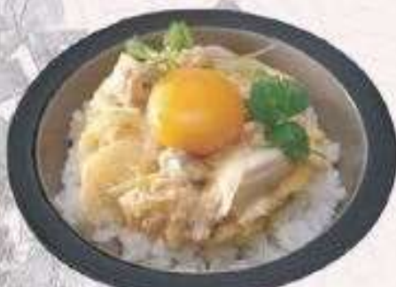
CƠM GÀ TRỨNG | C.07 OYAKODON | 55,000