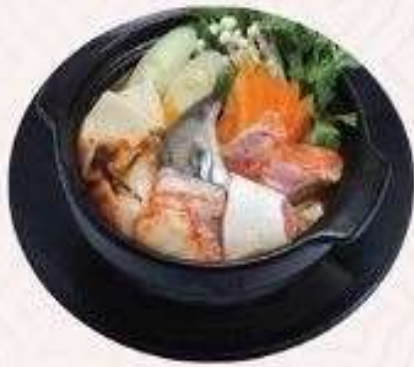
SÚP CÁ HỒI SALMON SOUP