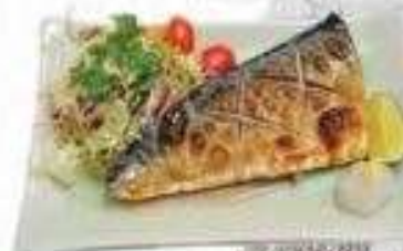
CÁ SAPA (1/2 con)