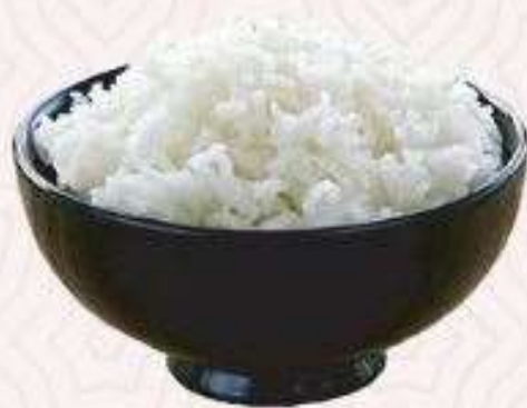
CƠM TRẮNG RICE