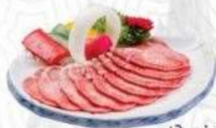
LƯỠI BÒ (180 gram)