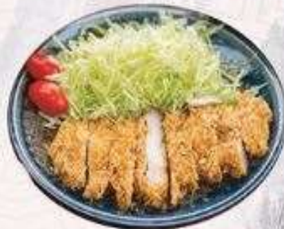
GÀ CHIÊN XÙ | K.05 CHICKEN CUTLET | 55.000