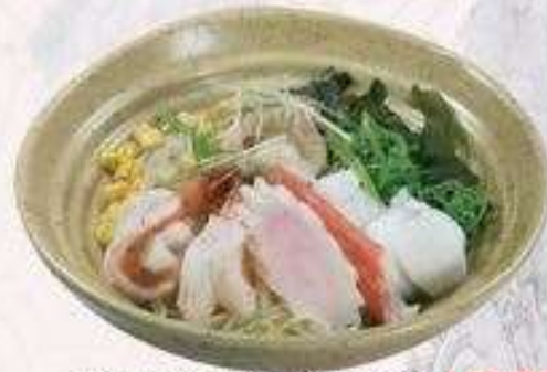
RAMEN HẢI SẢN XÀO | RA.05 STIR-FRIED SEAFOOD RAMEN | 60.000