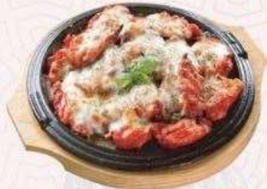
GÀ PHÔ MAI | K.03 CHIKEN WITH CHEESE | 55.000