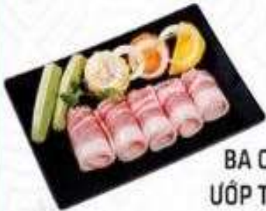
BA CHỈ HEO ỚP TIÊU ĐEN (200 gram)