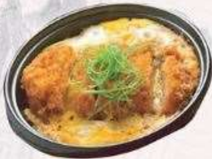
CƠM THỊT HEO CHIÊN XÙ | C.05 FRIED PORK RICE | 55,000