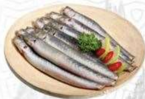
CÁ KÈO (200 gram)