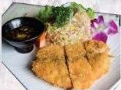
CÁ HỒI CHIÊN XÙ | K.04 SALMON CUTLET | 80.000