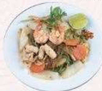
MIẾN XÀO HẢI SẢN | RA.07 FRIED SEAFOOD VERMICELLI | 60.000