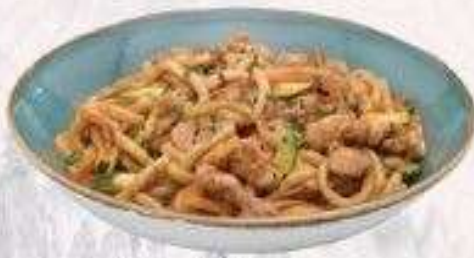
UDON BÒ MỸ XÀO | U.04 STIR-FRIED US BEEF UDON | 65,000