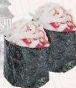
THANH CUA CRAB STICK | G.02 25.000