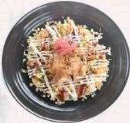
BÁNH XÈO NHẬT | K.02 OKONOMIYAKI | 55.000