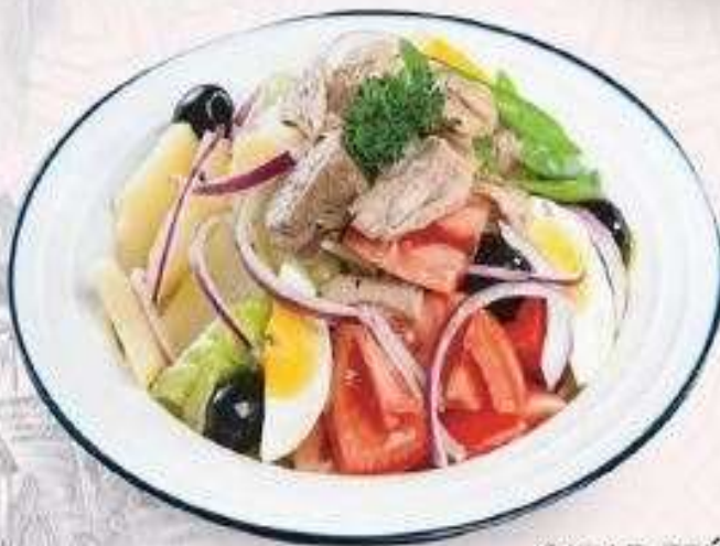
SALAD TRỨNG CÁ NGỪ | SA.07 TUNA EGGS SALAD | 55,000