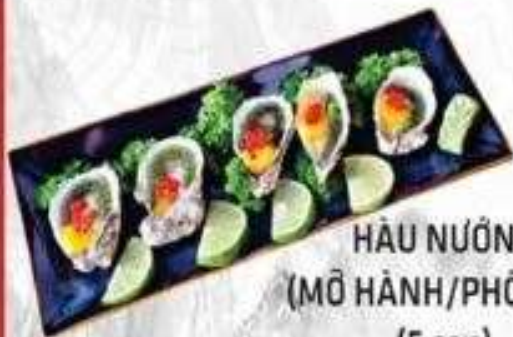
HÀU NƯỚNG (MỠ HÀNH/PHÔ MAI) (5 con)