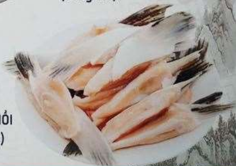
VÂY CÁ HỒI (180 gram)