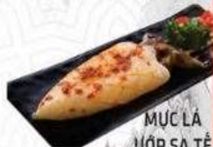
MỰC LÁ ƯỚP SA TÊ (180 gram)