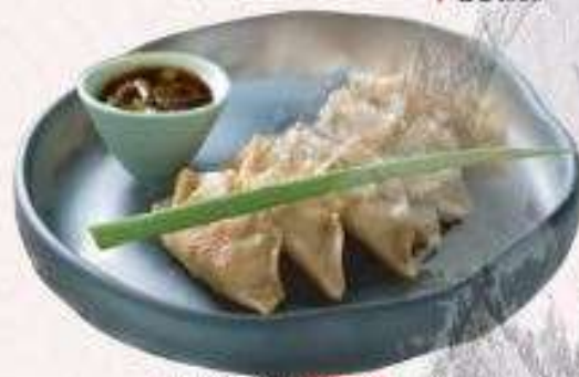
GYOZA | K.07 GYOZA | 45.000