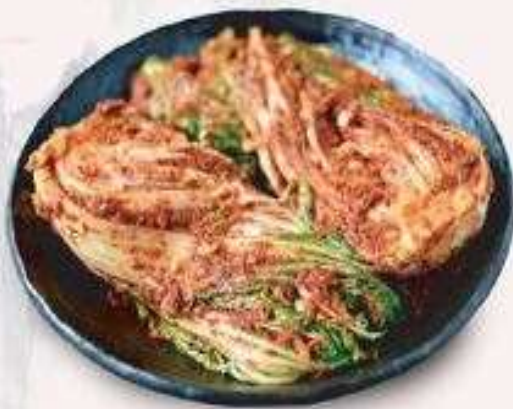
KIMCHI | A.03 KIMCHI | 15.000