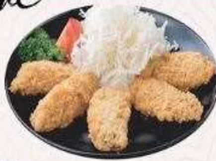
HÀU CHIÊN XÙ | K.01 FRIED OYSTER | 95.000