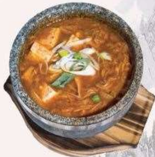
SÚP KIM CHI THỊT BÒ | A.04 KIMCHI SOUP WITH BEEF | 55.000