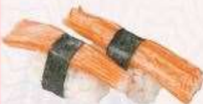
NIGIRI THANH CUA CRAB STICK NIGIRI | N.03 20.000