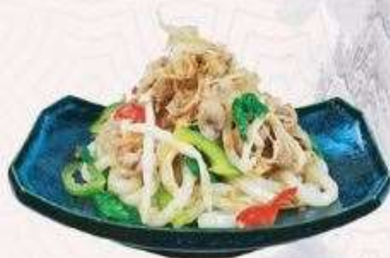
UDON THỊT HEO XÀO | U.07 STIR-FRIED PORK UDON | 60,000