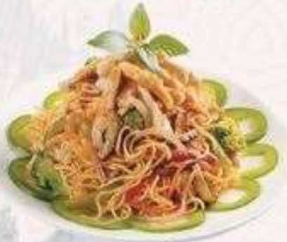
RAMEN THỊT HEO XÀO | RA.03 STIR-FRIED PORK RAMEN | 60.000