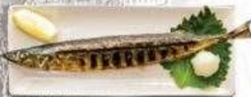
CÁ SANMA (2 con)