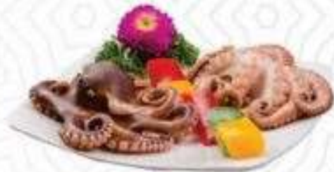
BẠCH TUỘC (180 gram)