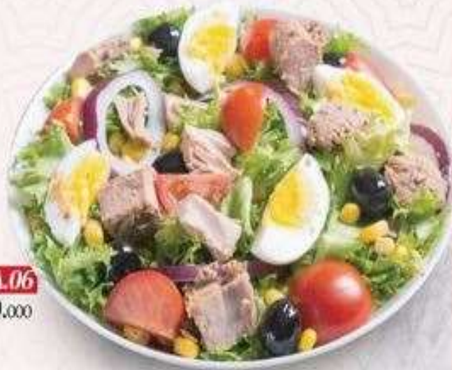
SALAD CÁ NGỪ NGÂM DẦU | SA.06 TUNA SALAD | 50,000