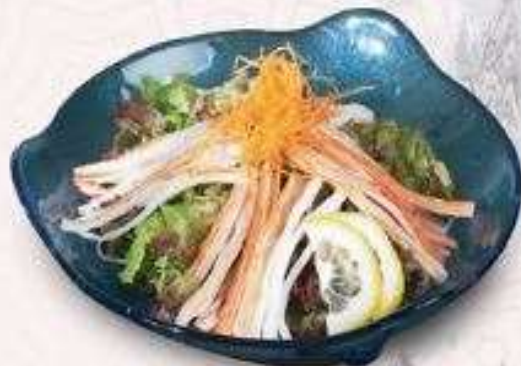
SALAD THANH CUA CRAB STICK SALAD