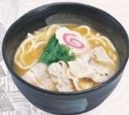
UDON THỊT HEO MISO | U.06 PORK UDON WITH MISO FLAVOUR | 60,000