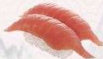
NIGIRI CÁ NGỪ TUNA NIGIRI | N.07 24.000