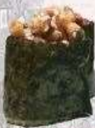
DA CÁ HỒI SALMON SKIN | G.01 25.000