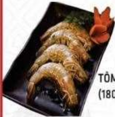
TÔM THÊ (180 gram)