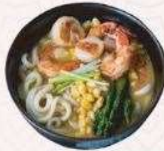
UDON HẢI SẢN | U.02 SEAFOOD UDON | 68,000