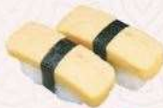
NIGIRI TRỨNG EGG NIGIRI | N.04 10.000