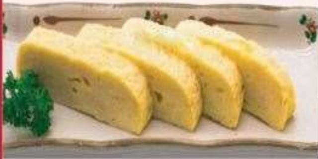
TRỨNG CUỘN | A.01 EGG ROLLS | 22.000