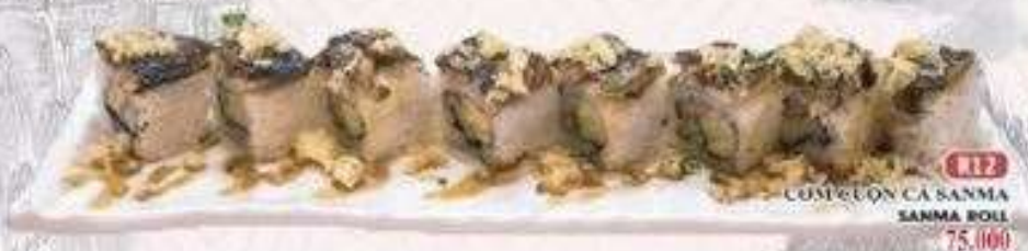
R.12 CƠM CUỘN CÁ SANMA SANMA ROLL 75.000