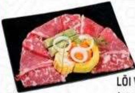
LỖI VAI BÒ (180 gram)