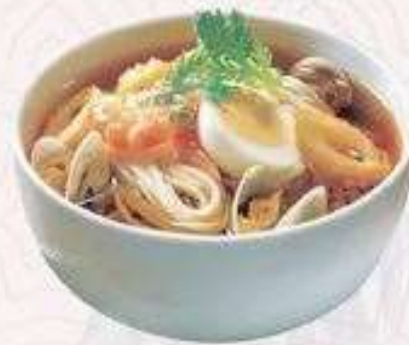
RAMEN HẢI SẢN | RA.04 SEAFOOD RAMEN | 60.000