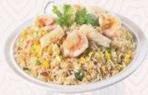
CƠM CHIÊN HẢI SẢN | C.04 FRIED RICE WITH SEAFOOD | 65,000