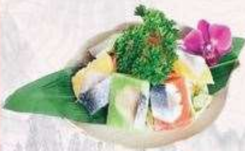
SALAD CÁ TRÍCH ÉP TRỨNG HERRING FISH SALAD