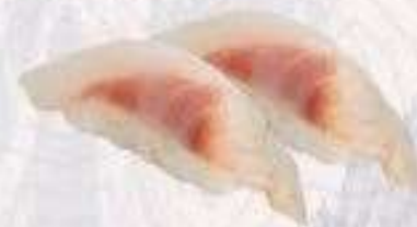
NIGIRI CÁ CHÈM BARRAMUNDI NIGIRI | N.08 22.000