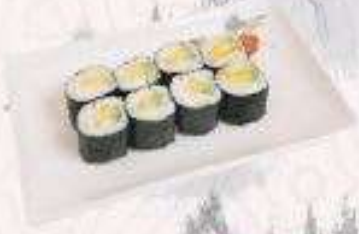
MAKI BƠ | M06 AVOCADO MAKI | 22,000