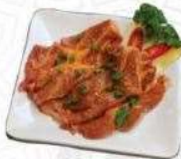
NAC DÂM ỚP SA TÊ (200 gram)