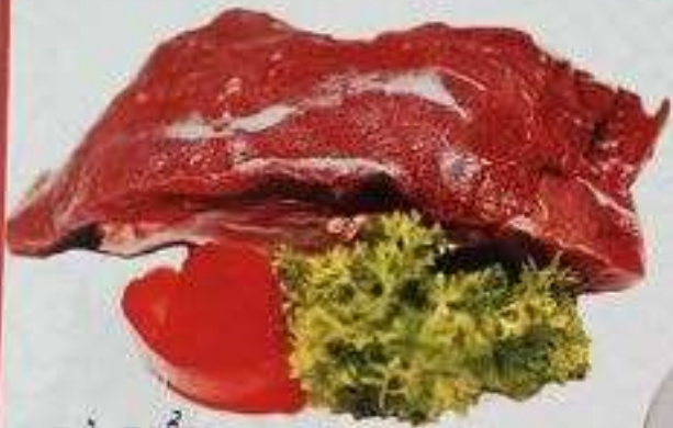
ĐÀ ĐIẾU (180 gram)