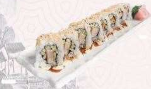
HEO CHIÊN PHÔ MAI | M07 CHEESE PORK ROLL | 48,000