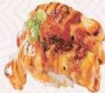
CÁ HỒI SỐT TIÊU SALMON W/PEPPER SAUCE | N.02 78.000