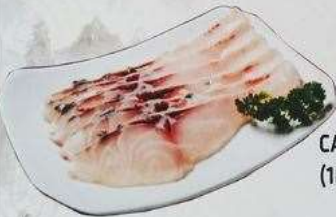
CÁ GIÒN (180 gram)