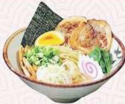
RAMEN THỊT GÀ | RA.02 CHICKEN RAMEN | 65.000