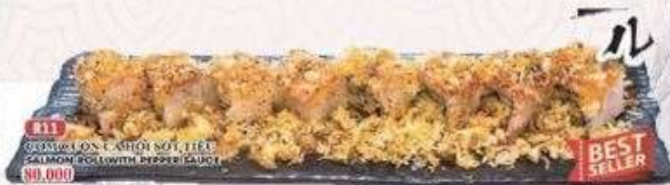
R.11 CƠM CUỘN CÀNH SỐT, HỒI SALMON ROLL WITH PEPPER SAUCE 40.000