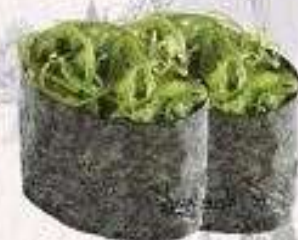
RONG BIỂN TRỘN MÈ WAKAME | G.04 25.000