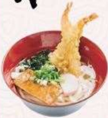
UDON TÔM TEMPURA | U.01 TEMPURA UDON | 68,000