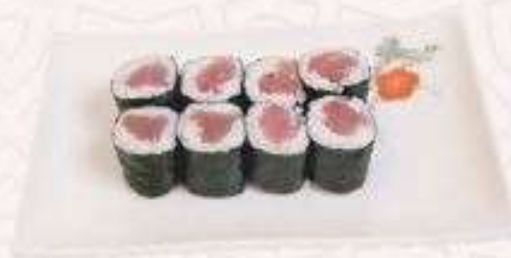
MAKI CÁ NGỪ | M02 TUNA MAKI | 34,000