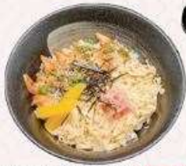
CƠM LƯƠN NHẬT | C.01 GRILLED EEL RICE | 60,000