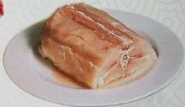
CÁ SẦU (180 gram)