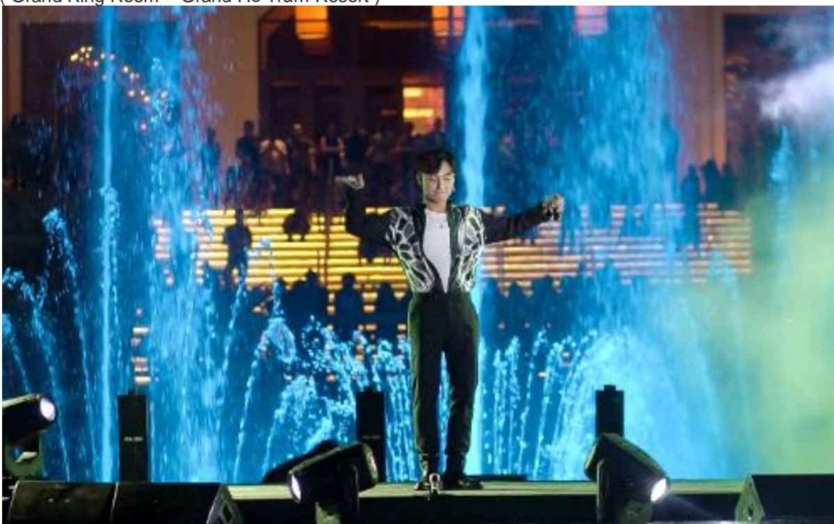
(Đài nhạc nước tại Grand Hồ Tràm Strip hàng đêm từ 18h00 – 21h00 )