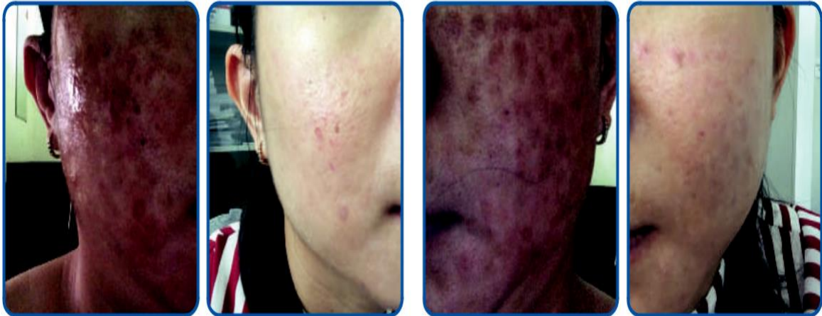
Trước điều trị Da mặt sưng, tấy đỏ, đau nhức.