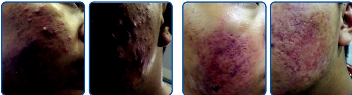
Trước khi điều trị Da mặt nhiều mụn bọc sưng đỏ, đau rát.