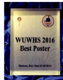
Giải Poster xuất sắc nhất - Italy 2016