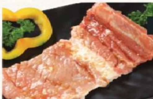
D1. Sườn heo bản lớn

Đến với King BBQ Buffet, thực khách sẽ cảm nhận thấy sự khác biệt, nổi bật của chất lượng thịt bò Mỹ từ độ ngọt của thịt, các vân mỡ đến thớ thịt đều được đảm bảo đạt tiêu chuẩn theo phân loại của từng loại thịt. Tất cả thịt bò đều được nhập khẩu trực tiếp từ Mỹ và phải trải qua quy trình kiểm tra nghiêm ngặt và khép kín theo quy chuẩn quốc tế từ nông trại đến quá trình lấy thịt, bảo quản và vận chuyển.