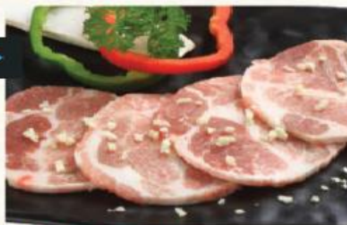
D2. Nạc dăm sốt tỏi

Pork Collar With Garlic Sauce 매지 목살 (마늘소스)