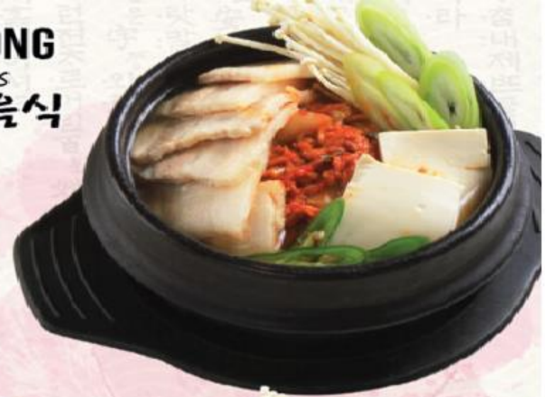
C1. Canh kim chi Kimchi Jjigae 김치찌개