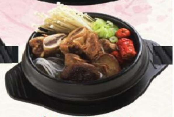
C3. Canh sườn bò Hàn Quốc Beef-in Short Ribs Korean Soup 한국 갈비탕