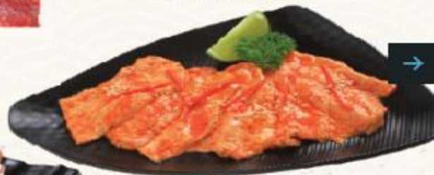
D21. Nấm heo nướng chao đỏ Pork Breast With Tofu Sauce 돼지고기 양념 구이