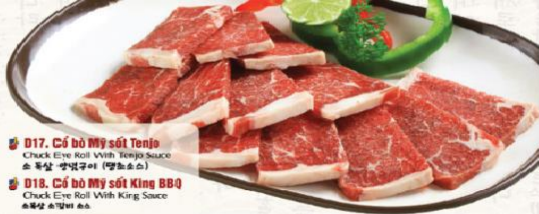
D17. Cỗ bò Mỹ sốt Tenjo Chuck Eye Roll With Tenjo Sauce 소 목살-양념구이 (텐조소스)