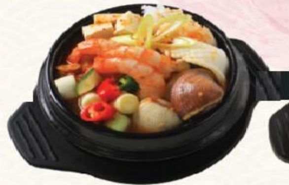
C2. Canh tương hải sản Korean Seafood Soup 해물 짜개