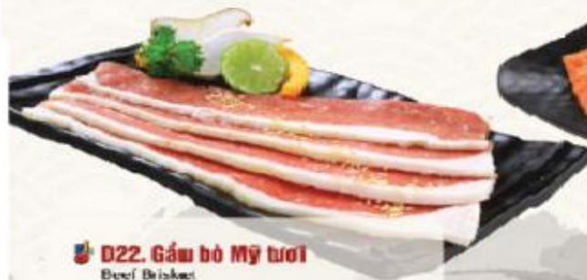
D22. Gấu bò Mỹ tươi Beef Brisket 소차돌생구이