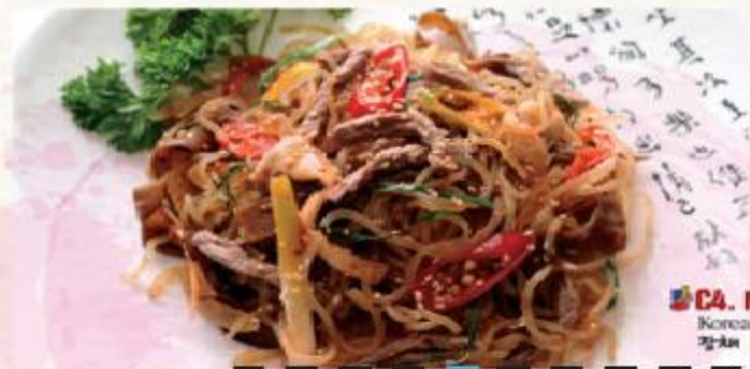
C4. Miến trộn Hàn Quốc Korean Glass Noodles 장채