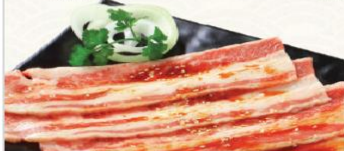
D3. Ba chỉ bò Mỹ sốt King BBQ

Pork Collar With Garlic Sauce 매지 목살 (마늘소스)