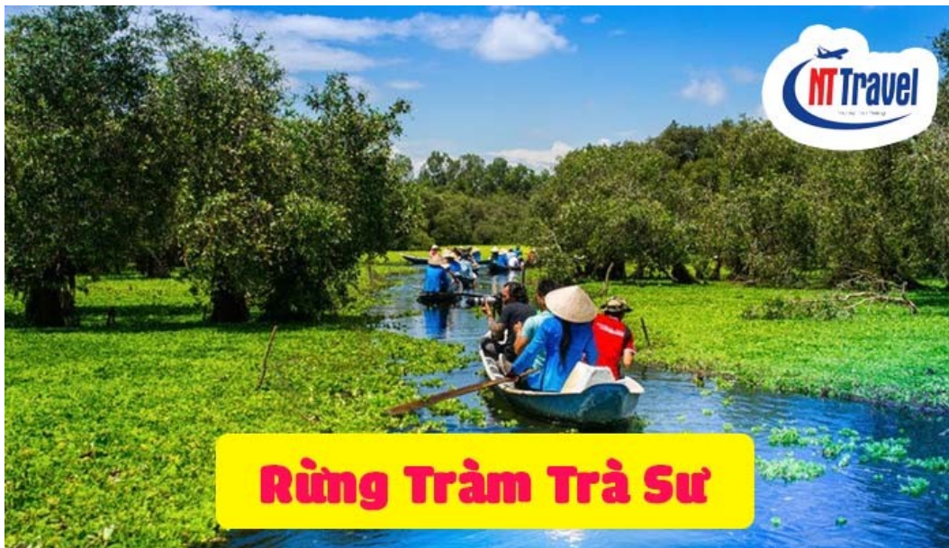
Rừng Tràm Trà Sư

11h00: Đoàn đến với khu du lịch Rừng Trà Sư , Khoác lên mình một màu xanh thắm của những cánh bèo tây tràn đồng. Đến nơi đây, quý khách sẽ được trải nghiệm thú vị không thể bỏ lỡ là đi thuyền trên đồng nước mênh mang, được tự tay chèo thuyền để cảm nhận vẻ đẹp thanh bình khi mũi thuyền nhẹ nhàng rẽ thảm bèo xanh mướt tiến sâu vào rừng. Với một Vọng gác quan sát ở giữa rừng, quý khách có thể ngắm nhìn được toàn bộ vẻ thanh bình của Rừng trà Trà Sư vào mùa nước nổi.