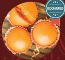
Bánh Bao Kim Sa 流沙包子