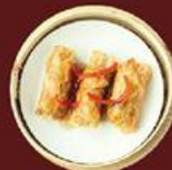
Tàu Hủ Kỳ Dầu Hào 蠔油鮮竹捲