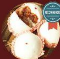
Bánh Bao Xả Xíu 叉燒包子