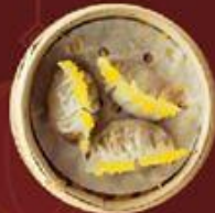
Triều Châu Cáo 潮州餃