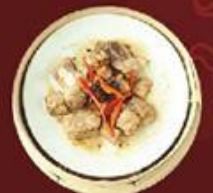
Sườn Non Tàu Xi 鼓汁蒸排骨