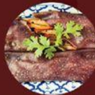
Bánh Gao Lút Xá Xiu 叉燒紅米腸粉