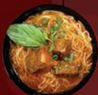
Hủ Tiu/Mỳ Sườn Hong Kong 港式排骨粉/麵