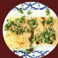
Bánh Cuon Tôm Chiên 脆皮煎蝦餅