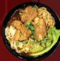
Hủ Tiu/Mỳ Bò Kho 牛腩粉/麵