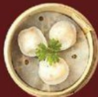
Cáo Thịt Cua 蟹肉餃