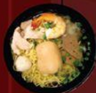
Hủ Tiu/Mỳ Thập Cẩm 什錦粉/麵