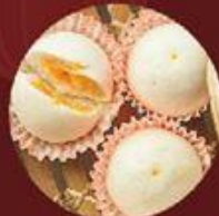
Bánh Bao Trứng Sữa 蛋奶包子