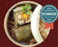
Xôi Gà Lá Sen 荷香糯米雞