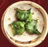
Phi Thúy Cáo 翡翠餃