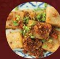
Khoai Môn Chiên Xù 蜂巢炸芋角