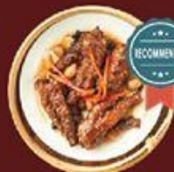
Chân Gà Tàu Xi 鼓汁蒸鳳爪