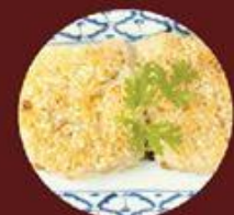
Xôi Gà Áp Chảo 香煎糯米雞