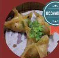
Há Cảo Tiêu Đen 黑胡椒蝦餃