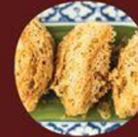
Khoai Môn - Bánh Cù Cải Chiên Trứng 芋頭-蘿蔔糕煎蛋