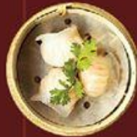
Há Cao 蝦餃