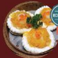
Nam Hải Minh Châu 南海明珠