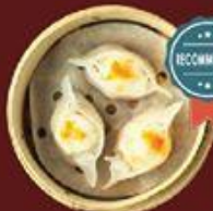
Sò Diệp Cáo 帶子餃