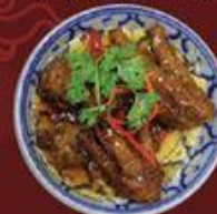
Chân Gà Tứ Xuyên 四川鳳爪