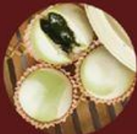
Bánh Bao Trà Xanh 綠茶包子