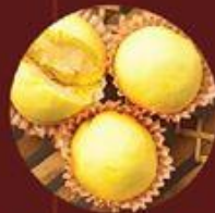
Bánh Bao Phô Mai 奶酪包子