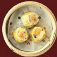
Xiu Mai 燒賣