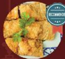
Tàu Hủ Kỳ Tôm Chiên 酥炸腐皮捲蝦