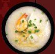
Cháo Hải Sản 海鮮粥