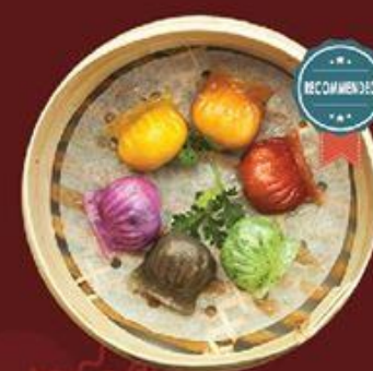
Hoa Khai Phú Quý 花開富貴

Cam: Vỏ Gấc nhân Thịt Gà 橙: 木鱉果皮 - 鸡肉 Tím: Vỏ Lá Cẩm nhân Tôm 紫: 品紅葉皮 - 鮮蝦 Vàng: Vỏ Bí Đỏ nhân Chả Cá 黃: 南瓜皮 - 魚腩