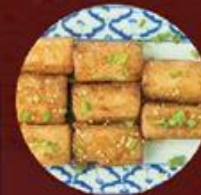
Bánh Cuốn Xi Dầu 豉油皇煎腸粉