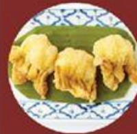
Hoành Thánh Tôm Chiên 明蝦角餃