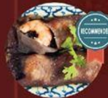
Bánh Gao Lút Tôm 鮮蝦紅米腸粉