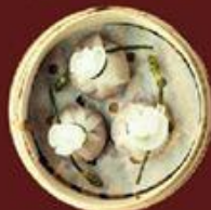
Vịt Quay Cáo 燒鴨餃