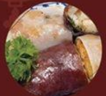
Loan Phụng Hòa Minh 鸞鳳和鳴