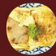
Khoai Môn - Bánh Cù Cải Chiên X.O X.O醬煎蘿蔔-芋頭糕