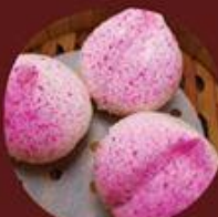
Trái Đào Thọ 蜜桃飽