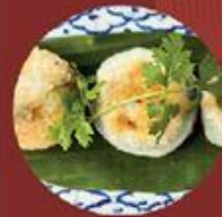
Bánh Hẹ 韭菜盒