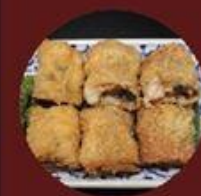
Chả Giò Trứng Bức Thảo 香茜皮蛋春卷