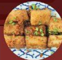
Bánh Cuốn X.O X.O 豉油皇煎腸粉