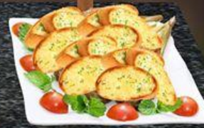
Bánh Mì Bơ Tỏi Fried Bread