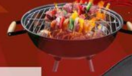
Ba Chi Heo Đực Sốt Mè German Pork Plate with Sesame Sauce