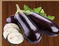
Cà Tím Eggplant