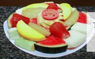
Trái Cây Theo Mùa Fruits