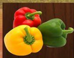
Ớt Chuông Capsicum