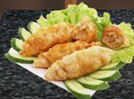
Mandu Chiên Fried Mandu