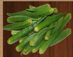
Đậu Bắp Okra