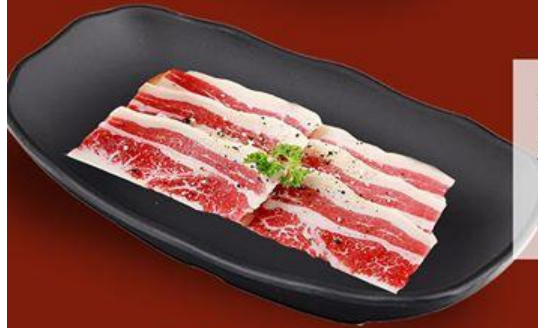
Ba Chi Bò Pháp Sốt Mè French Beef Plate with Sesame Sauce