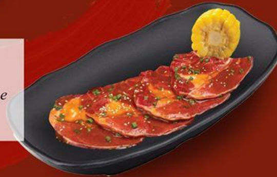
Ba Chi Bò Pháp Sốt Bơ French Beef Plate with Butter Sauce