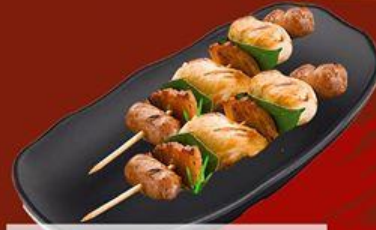
Gà Nướng Lá Chanh Chicken with Lemon Leaves