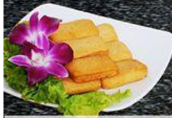
Đậu Hũ Cá Fried Singaporean Tofu