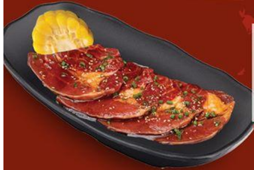
Ba Chi Bò Pháp Sốt Ngũ Vị French Beef Plate with Five-spices Sauce