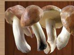
Nấm Đùi Gà King Oyster Mushroom