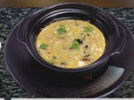
Súp Nấm Tuyết Nhĩ Snow Fungus Soup