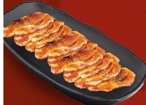
Thăn Heo Đực Sốt Mè German Pork Striploin with Sesame Sauce