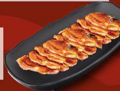
Thăn Heo Đực Sốt Muối Nepo German Pork Striploin with Salted Nepo Sauce