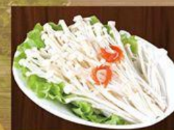
Nấm Kim Châm Enoki Mushrooms