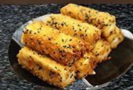
Chả Giò Fried Spring Rolls