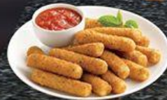
Phô Mai Que Mozzarella Stick