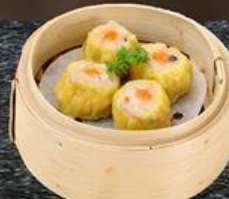
Xiu Mai Hấp Steamed Meatballs