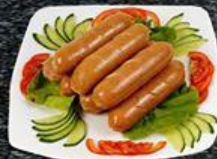
Xúc Xích Fried Hotdog