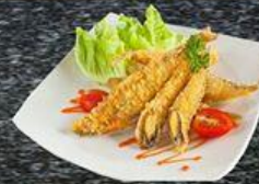
Cá Trứng Chiên Giòn Fried Smelt