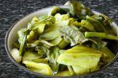
Dưa Muối Cabbage Pickles