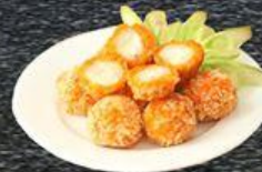
Cá Viên Sốt Mayonnaise Fish Rolled with Mayonnaise