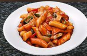
Tokbokki Korean Tokbokki