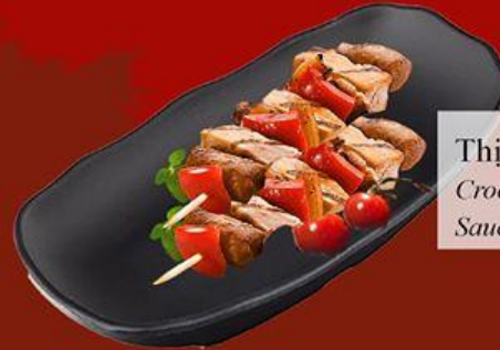
Thịt Cá Sấu Ngũ Vị Crocodile with Five-spices Sauce