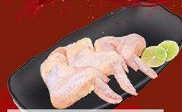
Cánh Gà Sốt Ngũ Vị Chicken Wings with Five-spices Sauce