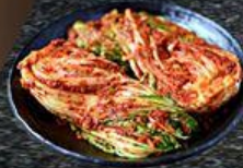
Kim Chi Kimchi

Gồm các món khai vị, tráng miệng dùng cho tất cả các gói buffet. Including appetizers and desserts used for buffet.