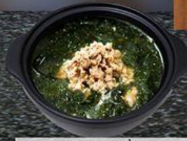
Canh Bò Bằm Rong Biển Aus Beef with Seaweed Soup