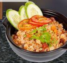
Cơm Chiên Bò Bằm Fried Rice with Minced Meat