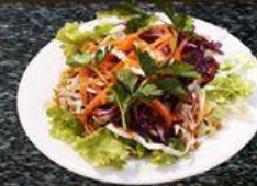
Salad Trộn Salad Mixed