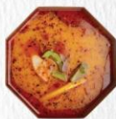
LẨU TOMYUM THÁI 泰国托老 Thai Tom Yum Hotpot