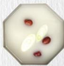
LẨU COLLAGEN 胶原蛋白锅 Collagen Hotpot