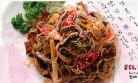
C4. Miến trộn Hàn Quốc Korean Glass Noodles 잡채

Mình Anh trên menu có thể khác so với thực tế. Giá buffet chưa bao gồm 10% VAT và đồ uống.