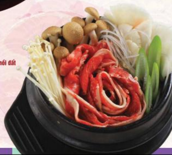
C7. Bò xào Bulgogi nới đất Bulgogi 불고기 육회