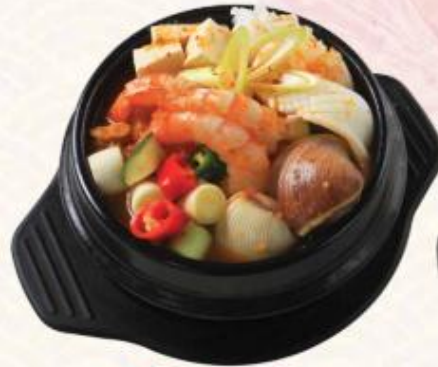
C2. Canh tương hải sản Korean Seafood Soup 멸치장 찜찌개