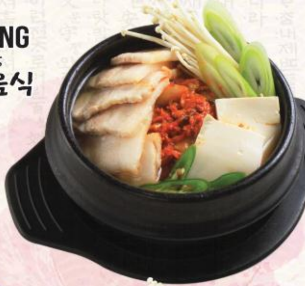
C1. Canh kim chi Kimchi Jjigae 김치찌개