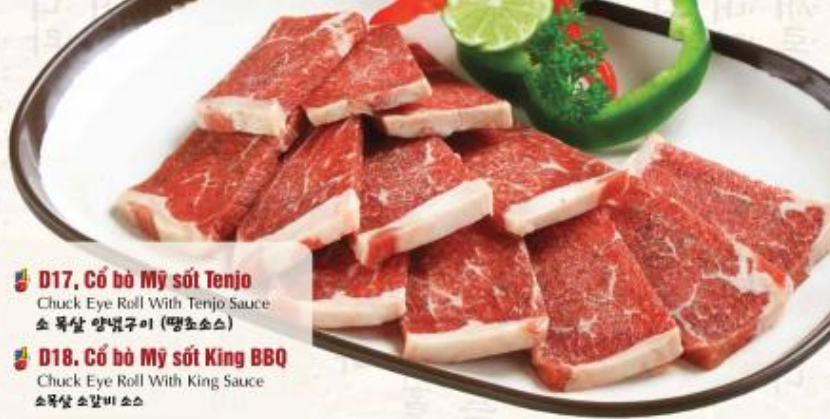
D17. Cỗ bò Mỹ sốt Tenjo Chuck Eye Roll With Tenjo Sauce 소 목살 양념구이 (텐조소스)