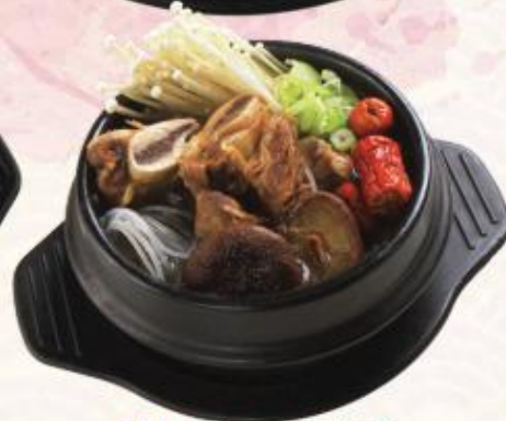
C3. Canh sườn bò Hàn Quốc Bone-in Short Ribs Korean Soup 한국 갈비탕