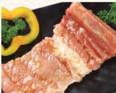
D1. Sườn heo bản lớn

Đến với King BBQ Buffet, thực khách sẽ cảm nhận thấy sự khác biệt, nổi bật của chất lượng thịt bò Mỹ từ độ ngọt của thịt, các vân mỡ đến thớ thịt đều được đảm bảo đạt tiêu chuẩn theo phân loại của từng loại thịt. Tất cả thịt bò đều được nhập khẩu trực tiếp từ Mỹ và phải trải qua quy trình kiểm tra nghiêm ngặt và khép kín theo quy chuẩn quốc tế từ nông trại đến quá trình lấy thịt, bảo quản và vận chuyển.