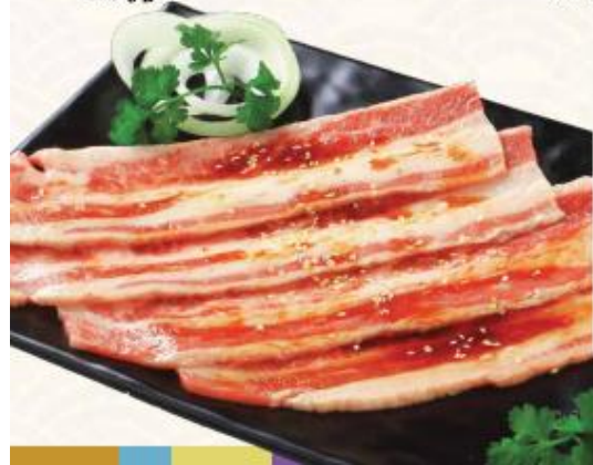
D3. Ba chỉ bò Mỹ sốt King BBQ

Pork Collar With Garlic Sauce 돼지 목살 (마늘소스)