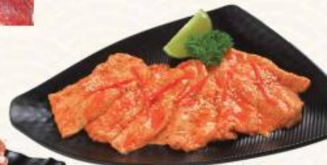
D21. Nám heo nướng chao đỏ Pork Breast With Tofu Sauce 돼지고기 양념 구이