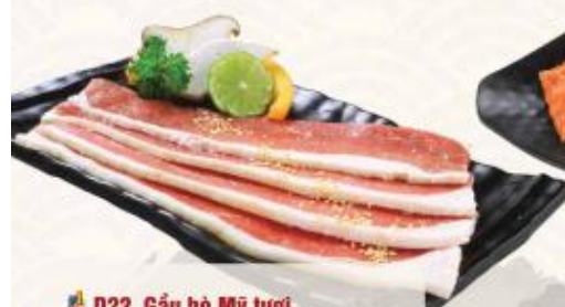
D22. Gấu bò Mỹ tươi Beef Brisket 소차돌생구이