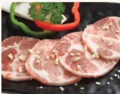
D2. Nạc dăm sốt tỏi

Pork Collar With Garlic Sauce 돼지 목살 (마늘소스)