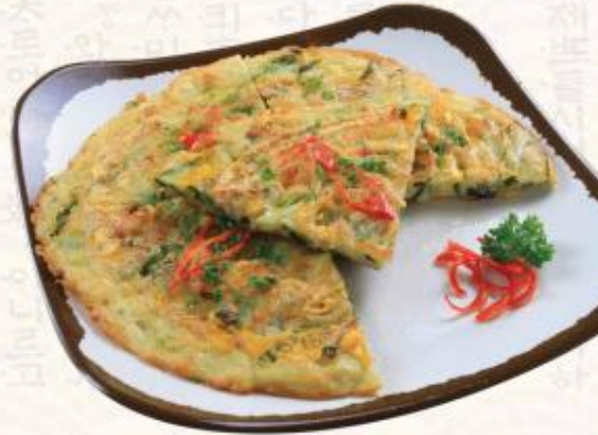
C5. Bánh hành hải sản Korean Seafood Pancake 해물 파전