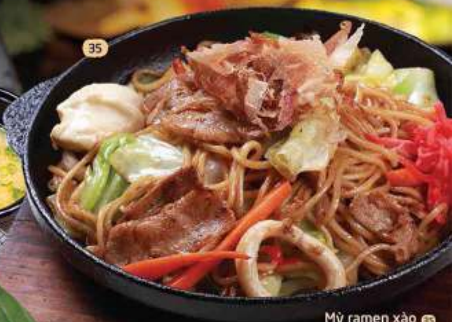
Mỳ ramen xào 35 Yaki ramen 焼きそば