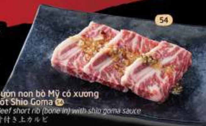
Sườn non bò Mỹ có xương sốt Shio Goma 54

Beef short rib (bone in) with shio goma sauce