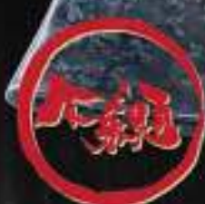
Thăn ngoại bò Mỹ sốt Shio 56