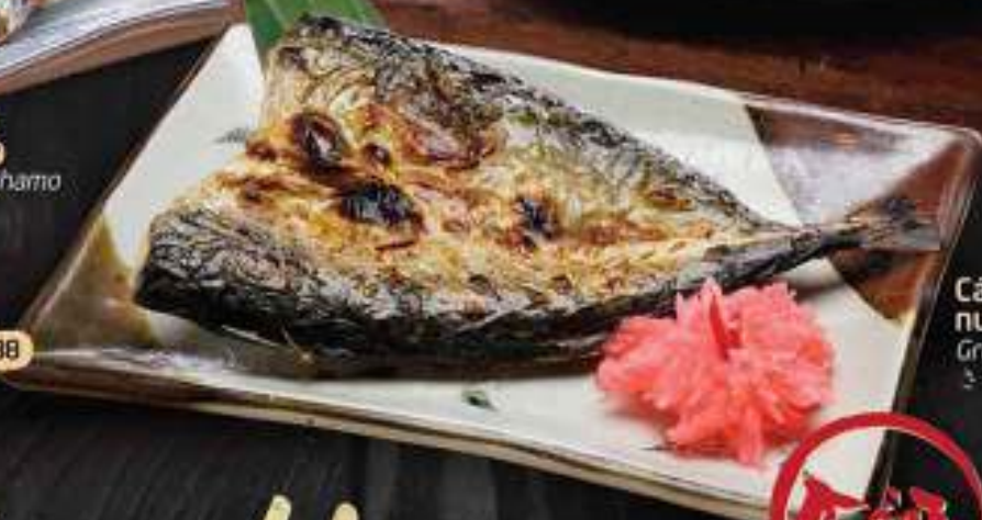
Cá Saba nướng muối 38 Grilled Saba fish さば 塩焼き