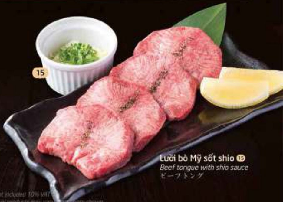
Lưỡi bò Mỹ sốt shio 15 Beef tongue with shio sauce ビーフトンガ