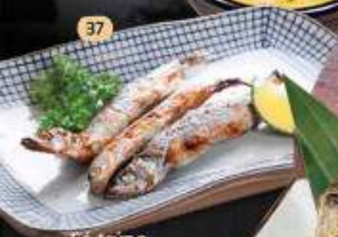
Cá trứng nướng 37 Grilled shishamo ししほも