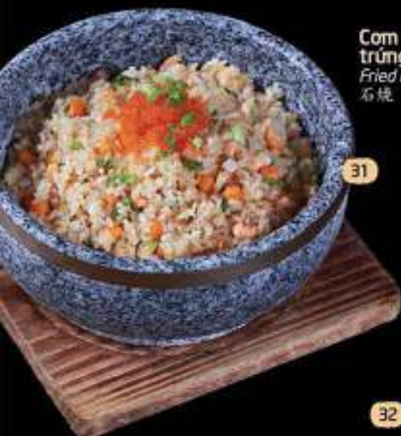
31 Cơm rang cá hồi trứng tôm Fried rice with salmon & tobiko 石焼 ガーリックチャーハン