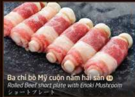
Ba chỉ bò Mỹ cuộn nấm hải sản 14 Rolled Beef short plate with Enoki Mushroom ショートプレート