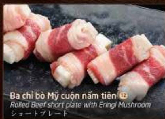
Ba chỉ bò Mỹ cuộn nấm tiên 12 Rolled Beef short plate with Eringi Mushroom ショートプレート