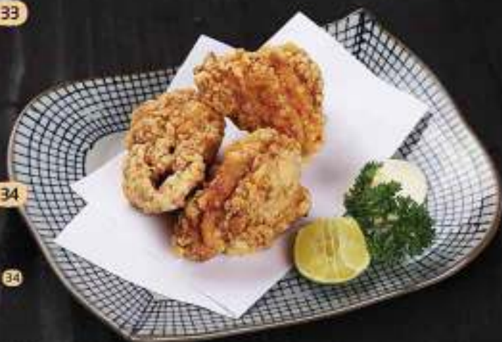
34 Gà rán kiểu Nhật Chicken Karaage 唐揚げ