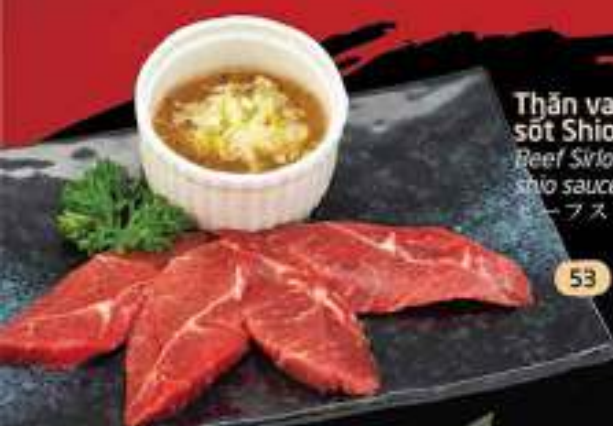
Thăn vai bò Mỹ sốt Shio 53