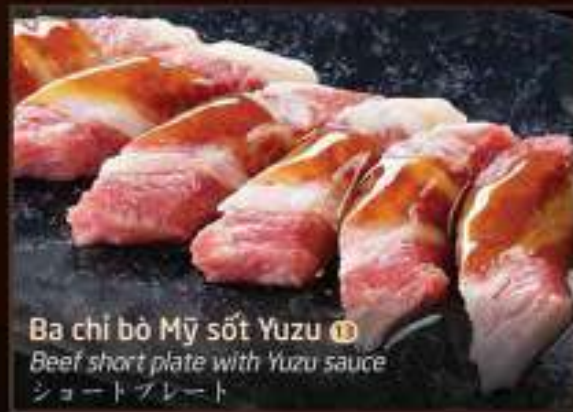
Ba chỉ bò Mỹ sốt Yuzu 13 Beef short plate with Yuzu sauce ショートプレート