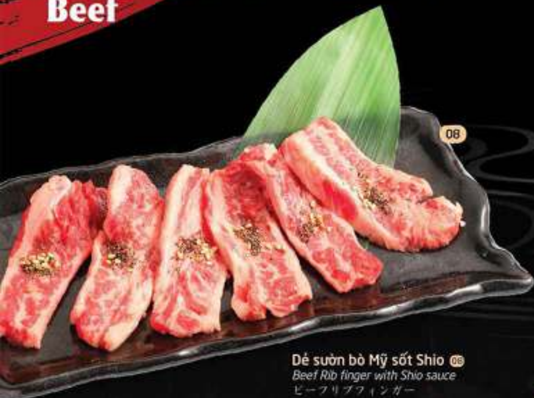
Dẻ sườn bò Mỹ sốt Shio 08 Beef Rib finger with Shio sauce ビーフリップフィンガー