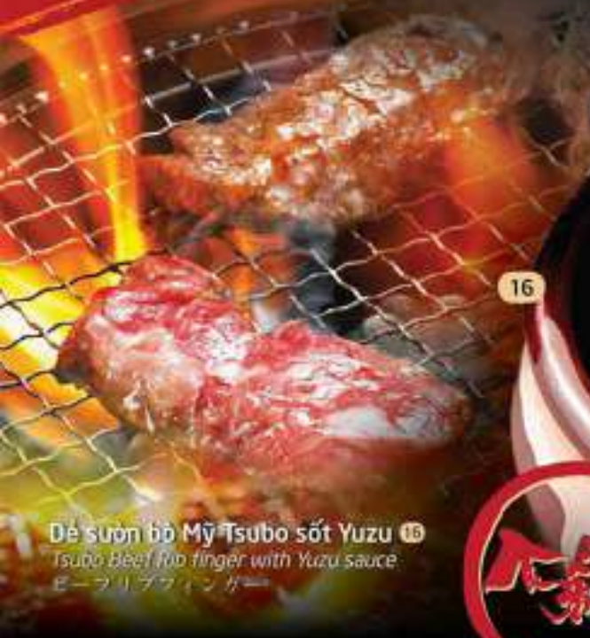
Dẻ sườn bò Mỹ Tsubo sốt Yuzu 16