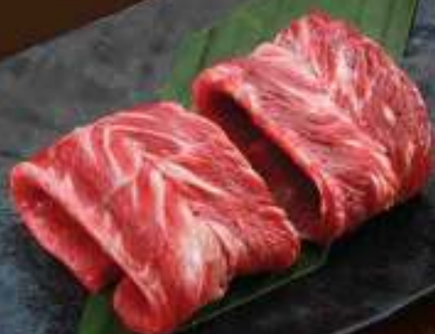
Dé sườn bò Mỹ 10 Beef Rib Finger ビープリブフィンガー