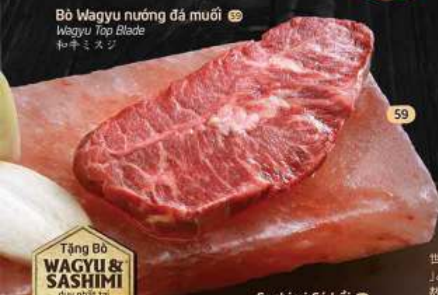
Bò Wagyu nướng đá muối 59