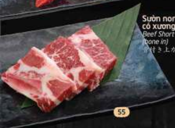
Sườn non bò Mỹ có xương 55