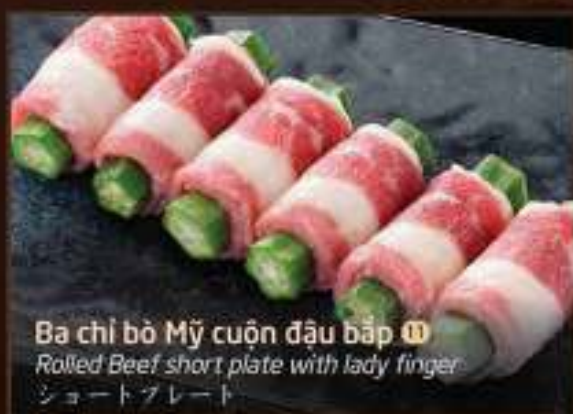
Ba chỉ bò Mỹ cuộn đậu bắp 11 Rolled Beef short plate with lady finger ショートプレート