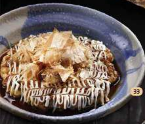
33 Bánh xèo Nhật Okonomi Yaki お好み焼き