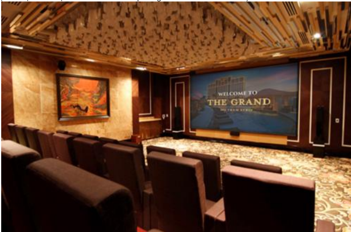
( Rạp Phim 3D tại Grand Hồ Tràm Strip 5* )