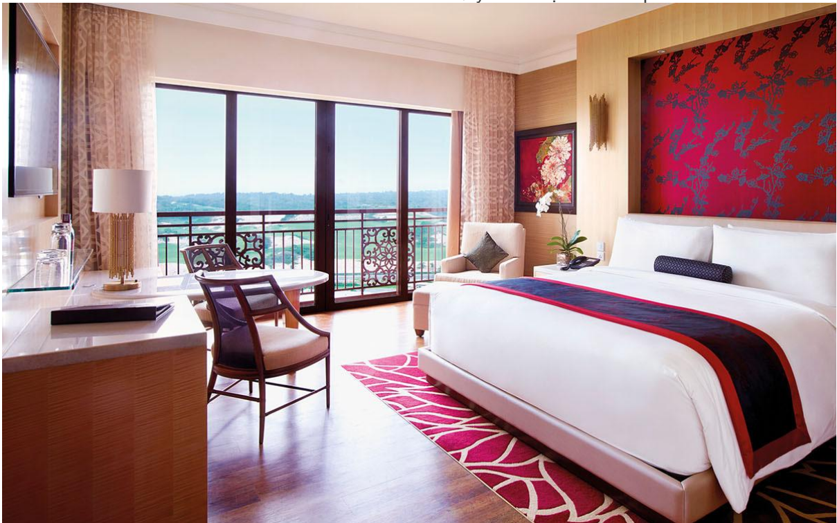
( Grand King Room – Grand Hồ Tràm Resort )

20h00: Xe đưa đoàn về Resort The Grand Hồ Tràm . Quý khách tự do khám phá Hồ Tràm về đêm.