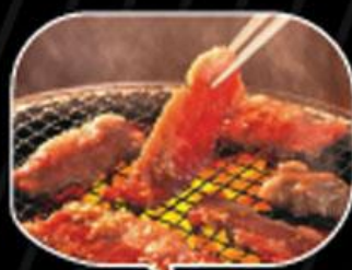
Nướng thịt chín vừa tới tẩm một lớp