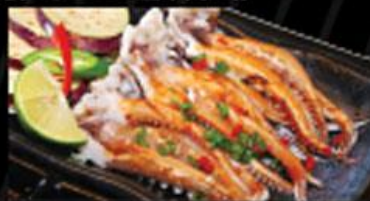
• Râu Mực Đại Dương Ocean squid beard 大洋烏賊の髭