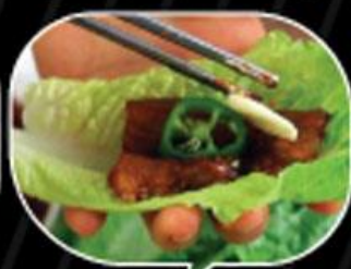
Cuốn thịt cùng kim chi, ớt, tỏi, dưa leo và sốt trong 1 lá xà lách tươi ngon