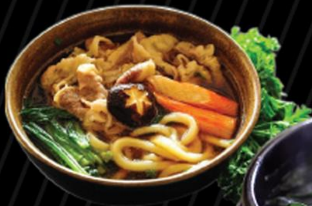
• Mì udon Udon noodle うどん