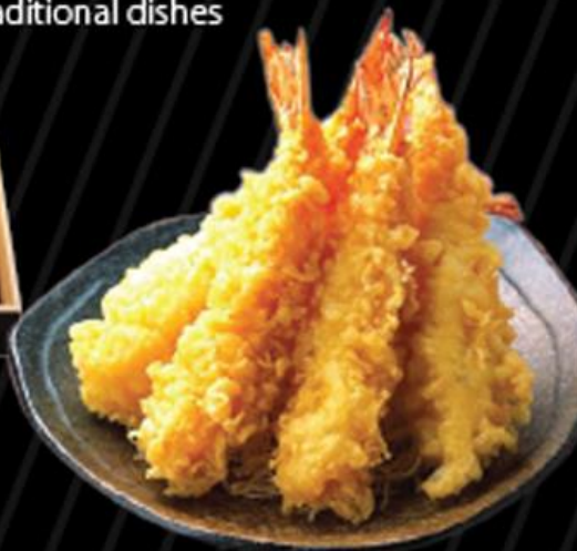
• Tempura Tempura てんぷら