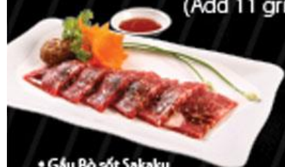
• Gấu Bò sốt Sakaku Brisket Point with Sakaku sauce サカ久ソース牛ロース肉