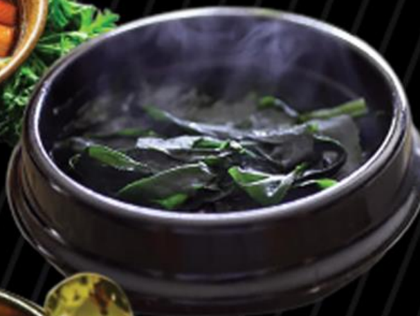
• Canh rong biển Seaweed soup 海草スープ