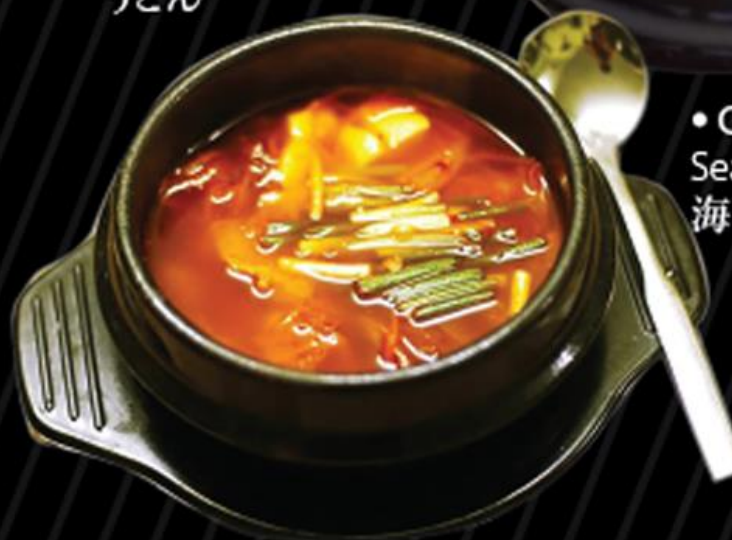
• Canh kim chi Kimchi soup キムチスープ