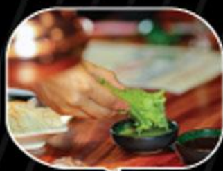
Chấm ngập vào nước sốt và thưởng thức