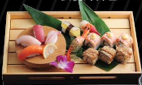
• Sushi Sushi すし