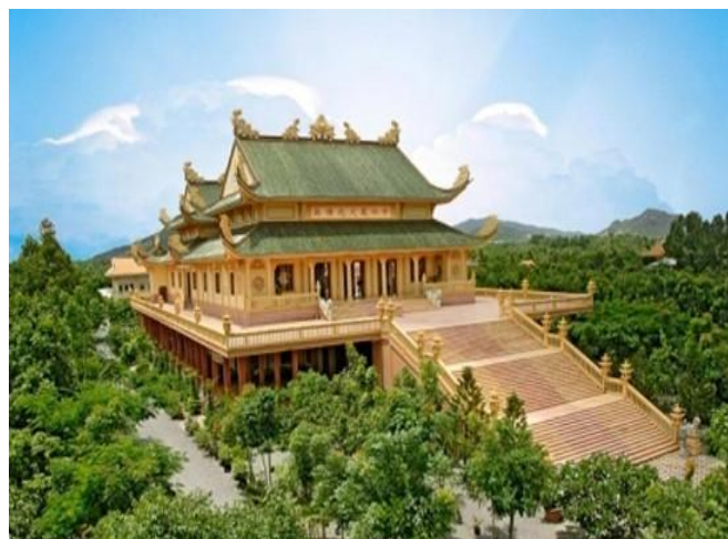
Vạn Phật Quang - Đại Tòng Lâm

Ven theo cung đường biển Vũng Tàu trước mặt quý phật tử là một bức tranh sống động đầy màu sắc, có biển, núi, đá và con người. Ánh nắng sáng của miền biển Cap Saint Jacques soi rọi làm cho cõi lòng thanh thản như hòa nguyện vào thiên nhiên mà đâu đó là tấm lòng từ bi bác ái trải rộng cùng với biển cả. Quý phật tử đến viếng thăm Niết Bàn Tịnh Xá tọa lạc trên triền núi Nhỏ (Vượt 37 bậc tam cấp lên đến ngôi chánh điện, trong chánh điện là một tượng Phật Nhập Niết