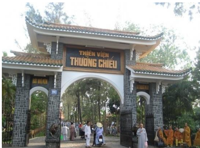
Thiền Viện Thường Chiếu

Quý phật tử dừng chân ngắm cảnh tại Thiền Viện Thường Chiếu (Chiêm ngưỡng vẻ đẹp tráng lệ của ngôi chánh điện giữa hai hàng dương xanh mượt, quý phật tử có những giây phút trải lòng mình vào khung cảnh thiên nhiên u tịch, tìm lại cảm giác thanh tịnh sau những ngày vất vả mưu sinh). Trên đường đi Quý phật tử dừng chân ghé ngắm cảnh Vạn Phật Quang - Đại Tòng Lâm (Ngôi chùa giữ nhiều kỷ lục Phật Giáo Việt Nam, với 48 tượng phật A Di Đà bằng đá hoa cương, ngôi chánh điện lớn nhất với Việt, bộ tượng Tam Thánh lớn nhất Việt Nam ...)