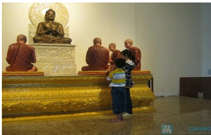
Chùa Bửu Long

Sau đó, xe đưa quý phật tử vào thành phố Vũng Tàu - Một thành phố với hơn 700 ngôi chùa nổi tiếng với du lịch nghỉ dưỡng bởi những bãi biển đẹp và là một trong những điểm hành hương thu hút phật tử nhiều nhất của cả nước.