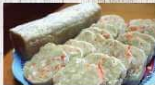
Bánh bó 15.000 VND