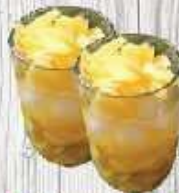
Chè mít đặc 14.000 VND