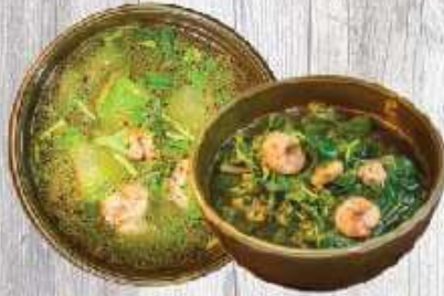
Tô Canh 15.000 VND