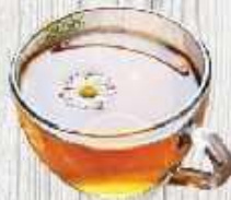
Nước bông cúc 9.000 VND/1 ly 32.000 VND/1 bình