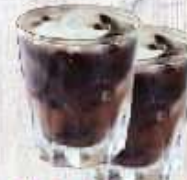
Chè đậu đen 14.000 VND