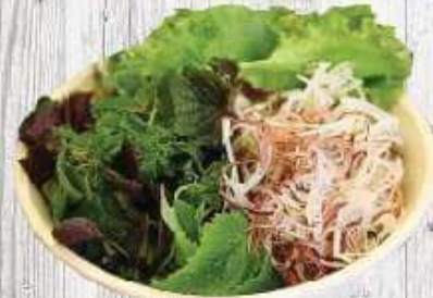
Rau 10.000 VND