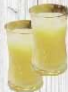
Sữa đậu xanh 14.000 VND