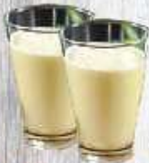
Sữa đậu nành 9.000 VND