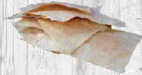
Bánh trắng -Loại mỏng: 5.000 VND/1 cái -Loại có mè: 8.000 VND/1 cái -Loại sòng: 3.000 VND/1 cái