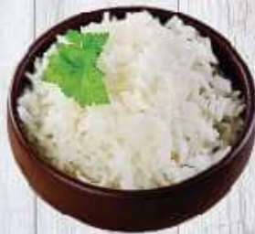
Cơm trắng -Chén: 5.000 VND -Thố: 15.000 VND