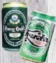
Bia lon 13.000 VND