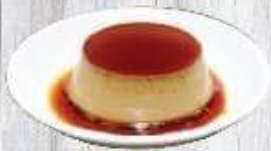
Bánh flan 9.000 VND