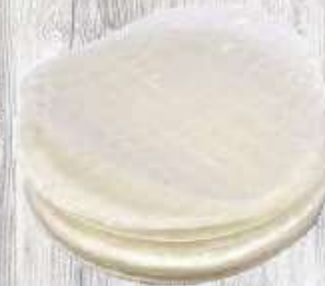
Bánh trắng nhúng 5.000 VND/1 phần