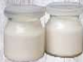
Sữa chua 7.000 VND