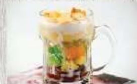
Chè thập cẩm 14.000 VND

NƯỚC LÁ CHÈ TƯƠI : 5.000 VND/1 ly 18.000 VND/1 bình