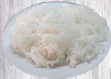
Bún 5.000 VND